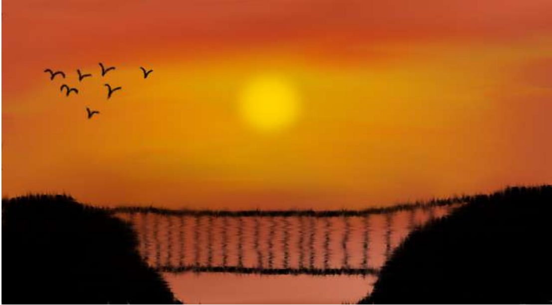
വിഷ്ണു എ. സു IX B