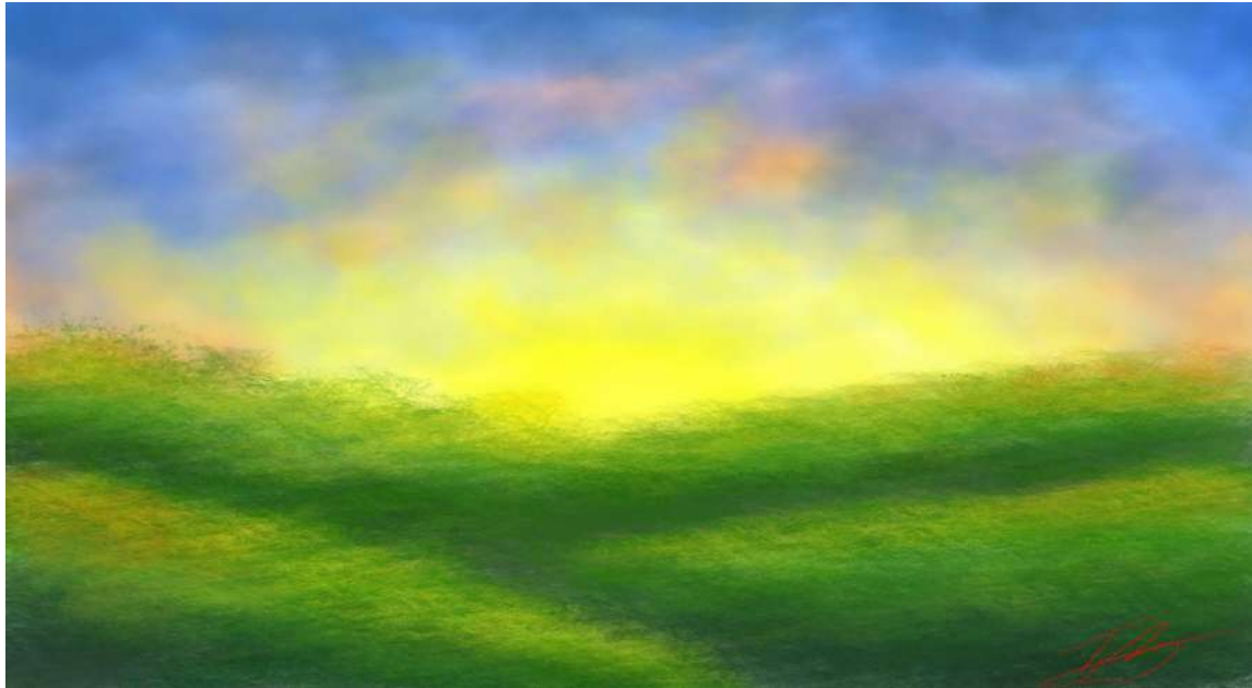
മുഹമ്മദ് ഇഹ്സാൻ IX C