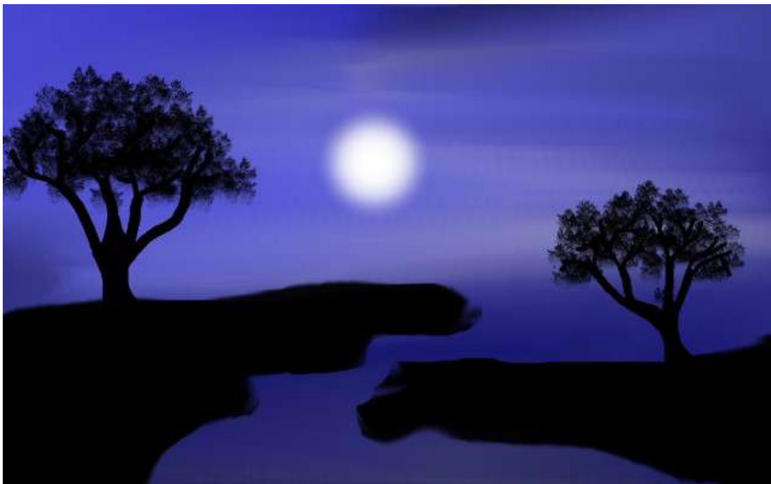
ശ്രീലക്ഷ്മി IX C