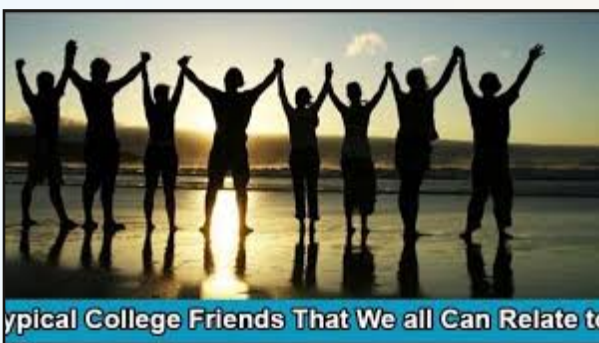
Typical College Friends That We all Can Relate to