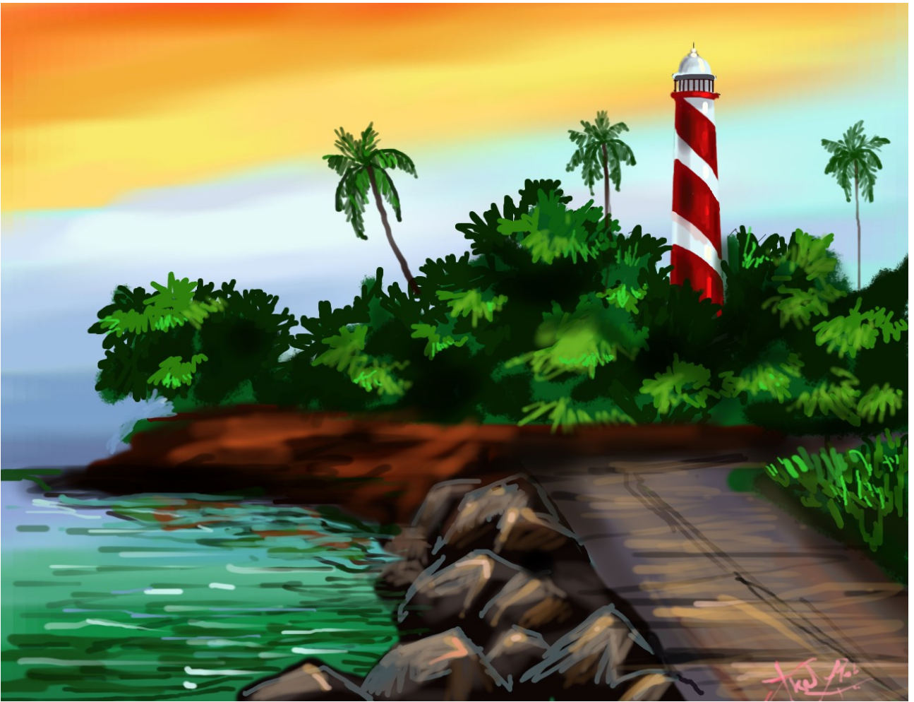
Digital painting of Akhil cleatus