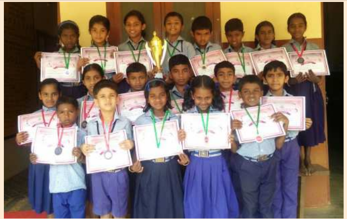
പഞ്ചായത്ത്തല കായികമേള രണ്ടാംസ്ഥാനം