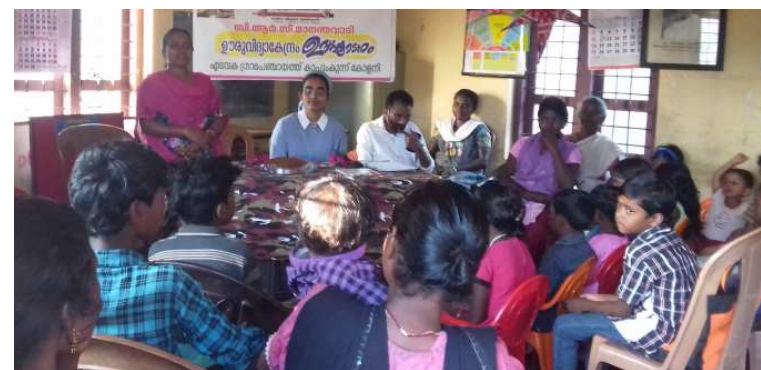
അക്ഷരദീപവുമായി വിവിധ കോളനികളിലൂടെ...