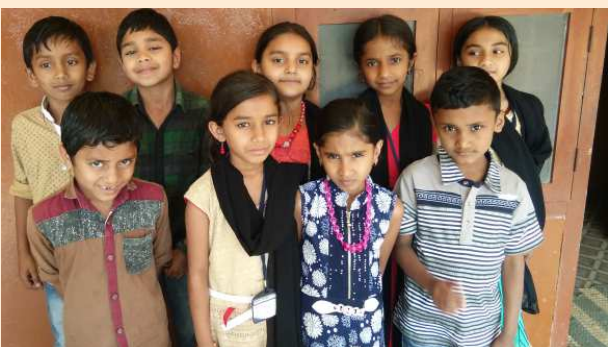
അറബി കലാമേളയിൽ മികവ് പുലർത്തിയവർ