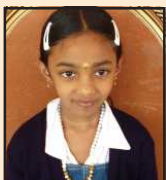
കൃഷ്ണപ്രിയ സബ്ജില്ല-ജില്ലാതലം പത്രകുടിംഗ ഒന്നാംസ്ഥാനം