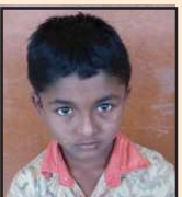
ക്രിസ്റ്റി റെയ്സൺ തോമസ് പഞ്ചായത്ത്തല ചിത്രരചന, ജലച്ചായം, ജില്ലാതല പ്രാദേശിക ചിത്രരചന ഒന്നാംസ്ഥാനം