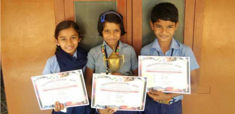
സബ്ജില്ലാതല ഗണിതശാസ്ത്രമേള രണ്ടാം സ്ഥാനം