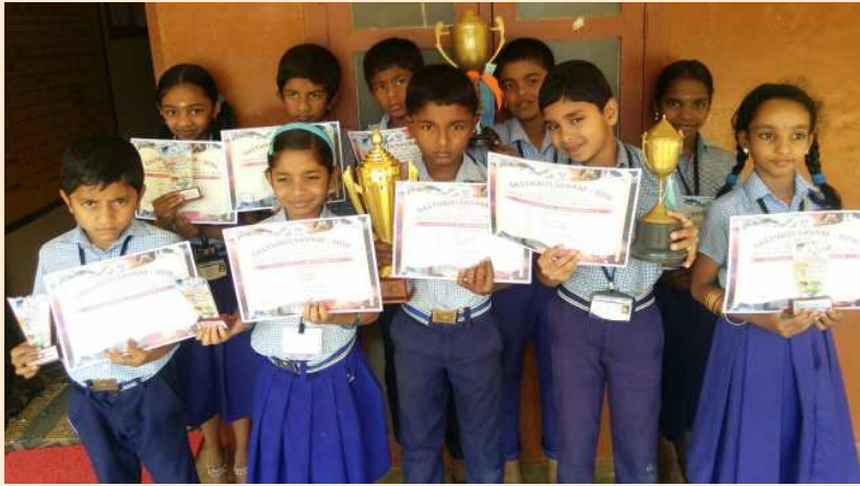
ജില്ലാ-സബ്ജില്ലാ സാമൂഹ്യശാസ്ത്ര മേള ഓവറോൾ കിരീടം