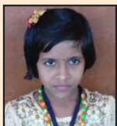
രഹ്ന ഹിരൺ സബ്ജില്ലാതല ഗണിതം പന്ത്രണ്ടാം സ്ഥാനം