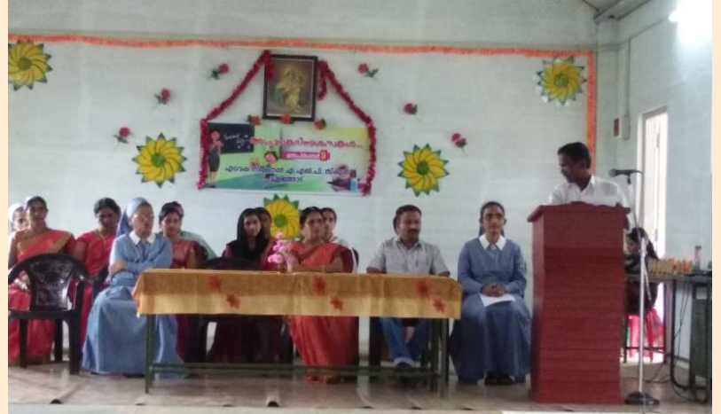
ആദരപൂർവ്വം - അധ്യാപകദിനാഘോഷം