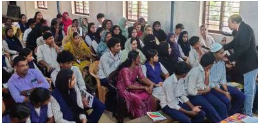
റിട്ടുന്നതിന് കുട്ടികളെ പ്രാപ്തരാക്കുക എന്ന ലക്ഷ്യത്തോടെയാണ്

കുപ്പാടിത്തറ: എസ് എസ് എൽ സി പരീക്ഷയ്ക്ക് തയ്യാറെടുക്കുന്ന പത്താം ക്ലാസിലെ വിദ്യാർത്ഥികൾക്കും അവരുടെ രക്ഷിതാക്കൾക്കും മോട്ടിവേഷൻ ക്ലാസ് സംഘടിപ്പിച്ചു. പരീക്ഷാകാലത്ത് മാനസിക സമ്മർദ്ദം കുറയ്ക്കുന്നതിനും ആത്മവിശ്വാസത്തോടെ പരീക്ഷയെ നേ