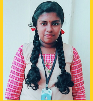
അക്ഷര. എസ്. എൽ