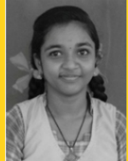
ദിവ്യശ്രീ.എസ് എസ് 10-എ