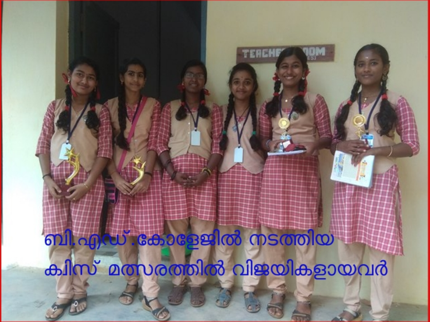
ബി.എഡ്.കോളേജിൽ നടത്തിയ കിസ് മത്സരത്തിൽ വിജയികളായവർ