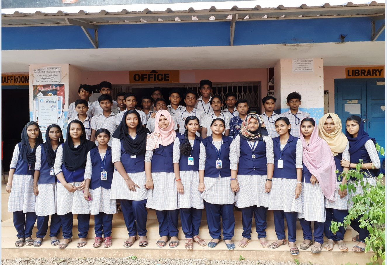
ലിറ്റിൽ കൈറ്റ്സ്@gvhss kadakkal