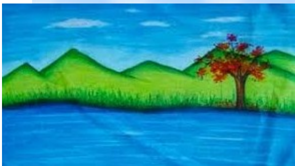
NANDANA SAJEEV Class:9