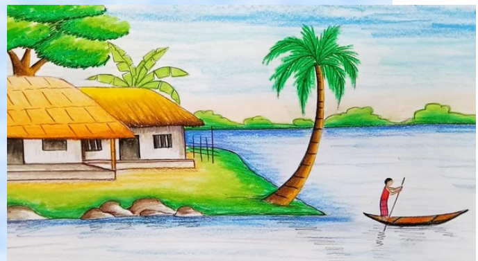
MUHAMMED MUZZAMMIL CLASS:9