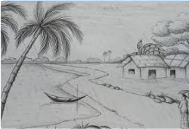
ATHUL KRISHNA.P.P CLASS:9