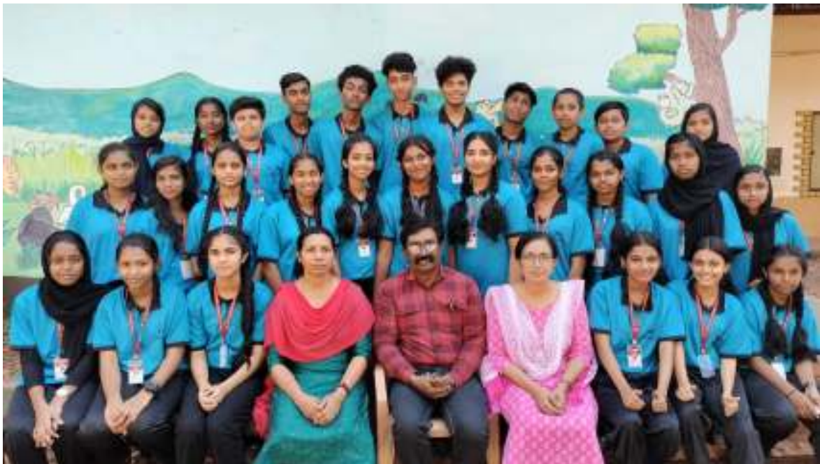
9th Batch 2022-25