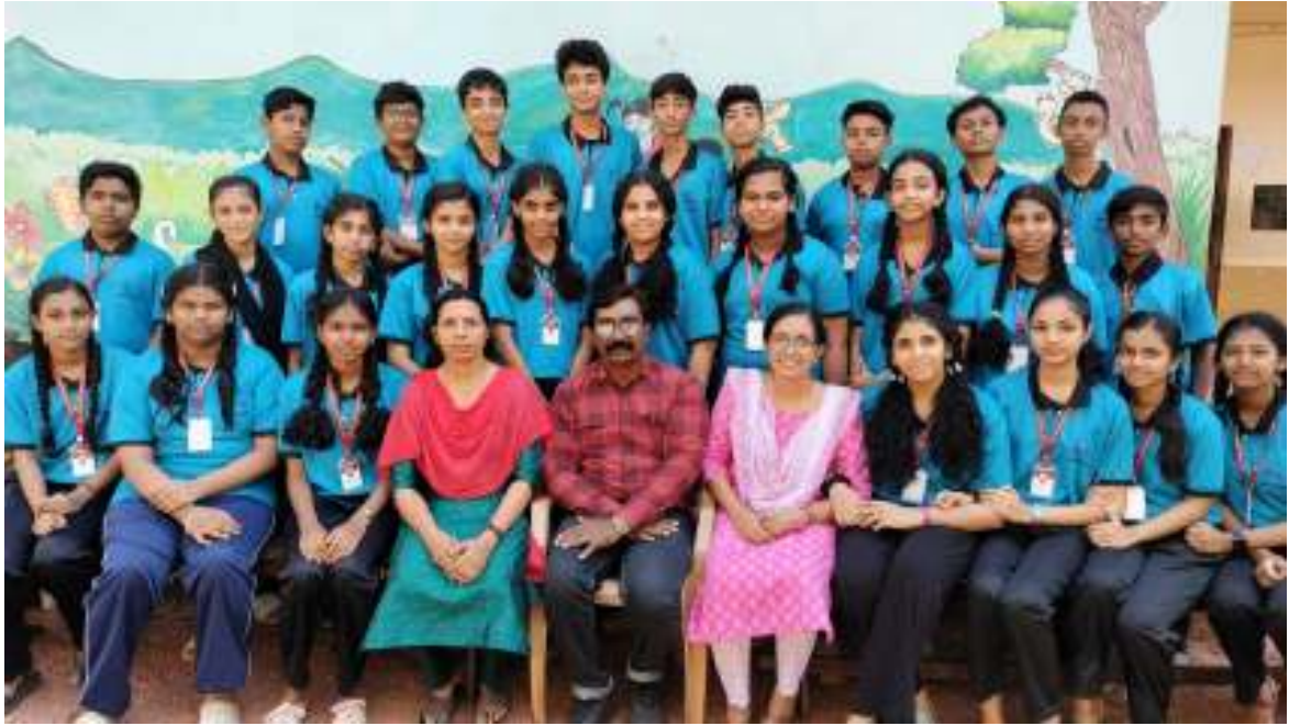
8th Batch 2023-26