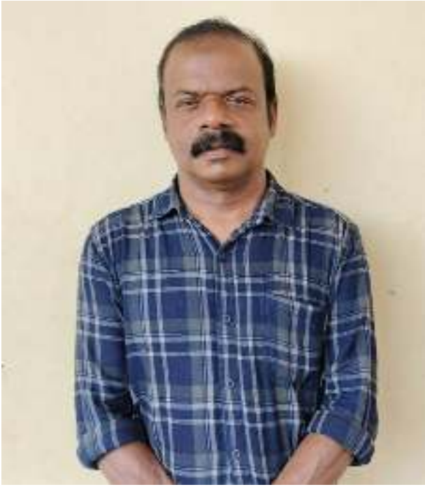
School IT Co-ordinator