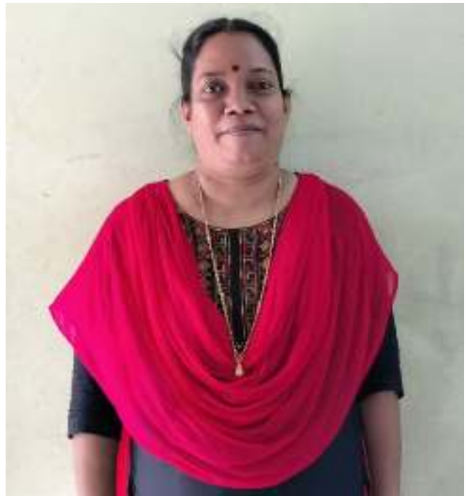
Joint School IT Co-Ordinator