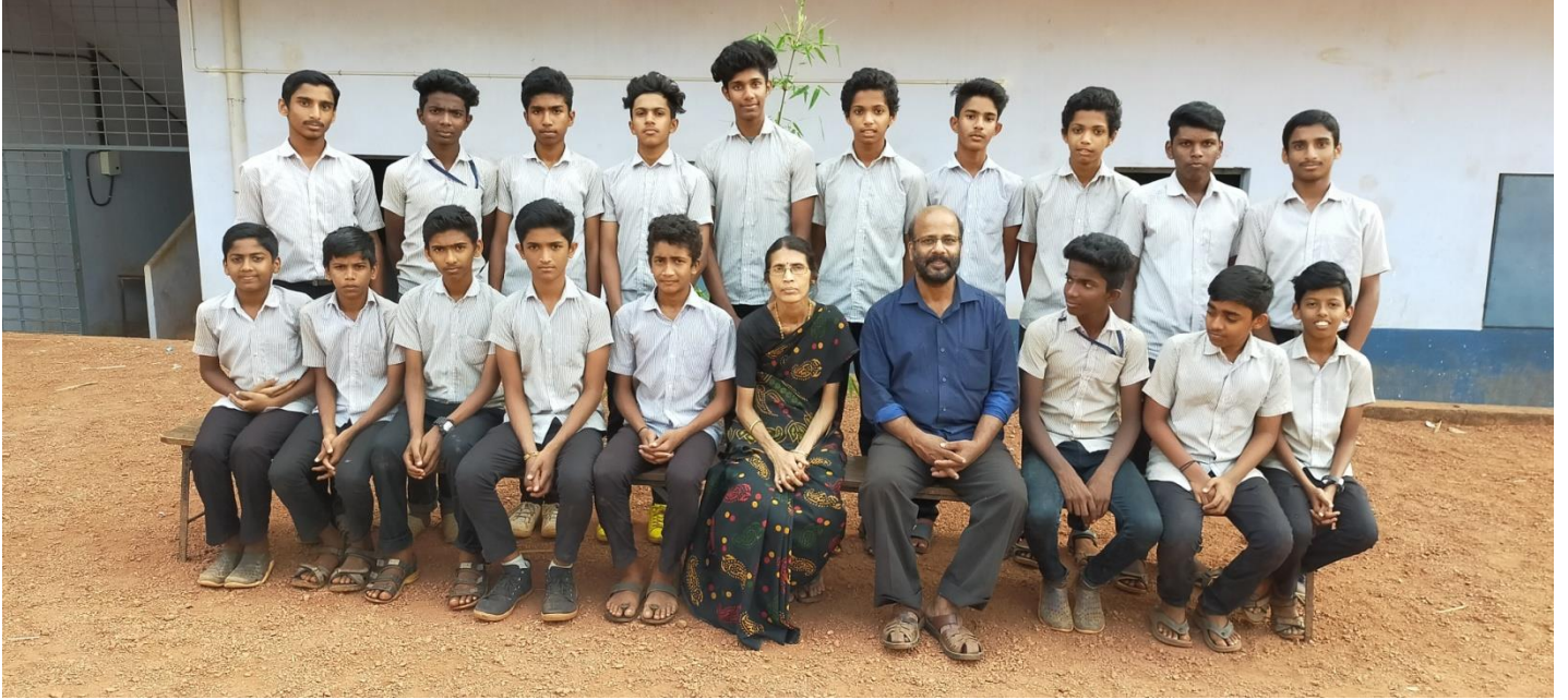
ലിറ്റിൽ കൈറ്റ്സ് അംഗങ്ങൾ 2019 -2021