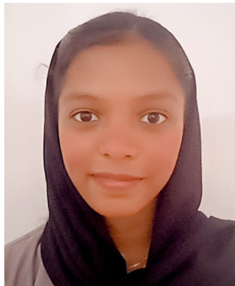
നൗഷിത. കെ. പി