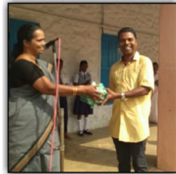
St Joseph's HS Sakthikulangara