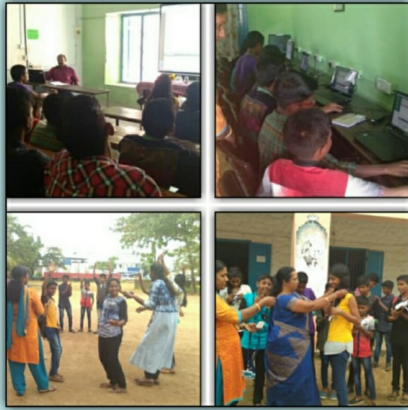
41072 St Joseph's Sakthikulangara Little Kites ഏകദിന ക്യാമ്പ്