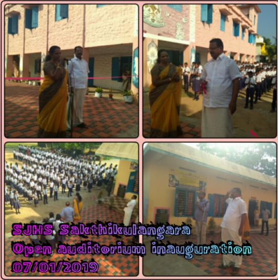
SJHS Sakthikulangara Open auditorium inauguration 07/01/2019