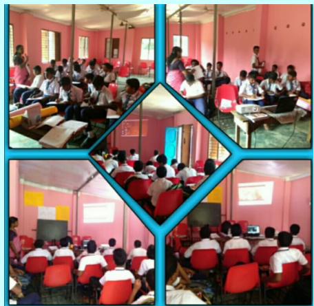
മലയാളത്തിളക്കം 2018-19 St Joseph's HS Sakthikulangara