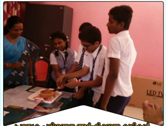
പ്രത്യേക പരിഗണന അർഹിക്കുന്ന കുട്ടികൾ അവർക്കായുള്ള ദിനാഘോഷം കേക്ക് മുറിച്ചു ആരംഭിക്കുന്നു.....