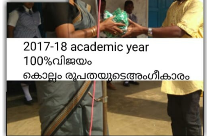
2017-18 academic year 100%വിജയം കൊല്ലം രൂപതയുടെ അംഗീകാരം