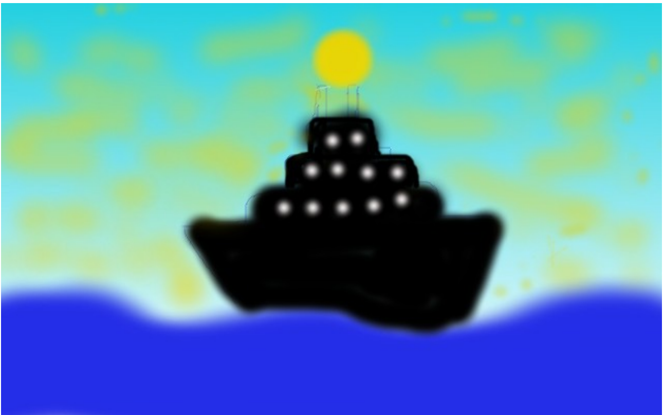
FASIL 9 C