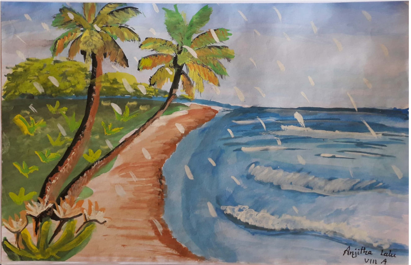
അഞ്ചിതലാലു - 8 എ