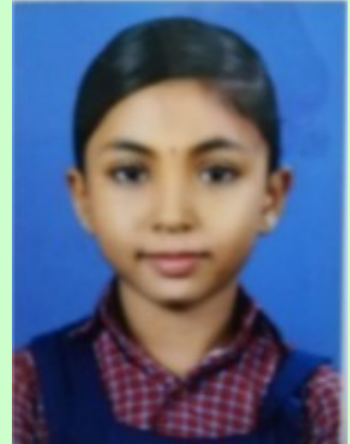
അനവദ്യ കെ. എ 5 B

വേനലിങ്ങെത്തി.ഒരു ദിവസം പുലർച്ചെ അവൻ എഴുന്നേൽക്കാൻ വൈകി, പെട്ടെന്ന് അമ്മയുടെ വിളി "മോനേ എഴുന്നേൽക്ക്, മണി ഒൻപതായി" അവൻ ഞെട്ടിയെഴുന്നേറ്റു. വേഗം പ്രഭാത കൃത്യങ്ങൾ ചെയ്തു. അതിനു ശേഷം നേരെ അമ്മയുടെ അടുത്തേക്ക് തന്നെയാണ് പോയത് .