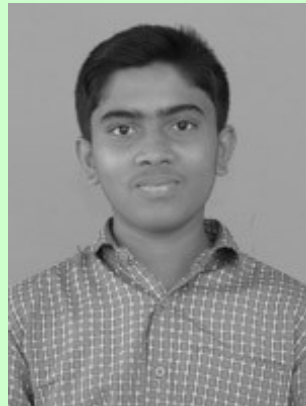
അദ്വൈത് എം എ 10 C