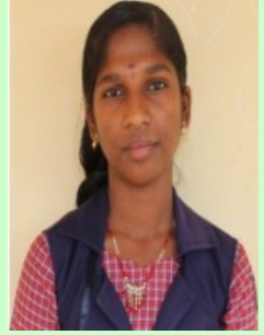
अतुल्य पी बी

किसान की आंखो से आंसू की नदी बह रहा है सूखी हरियाली का गंध भरी हुई हवा में दुःख का रंग है चुपके से बदल चली गई नदी हमारी जिन्दगी है नदी नहीं तो , जीवन नहीं पानी नहीं तो ,जीवन नहीं किसान का जीवन उसकी धरती से शुरू हुई है धरती में अंत हुआ है नदी चल गई नदी के पीछे किसान का जीवन भी चल गया नदी के किनारे किसान बैठा