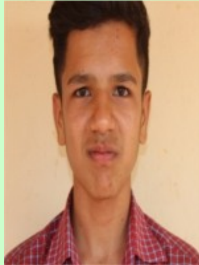
അർജുൻ എ 9 C