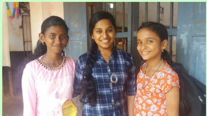
VIDYARANGAM STATE LEVEL PARTICIPANTS