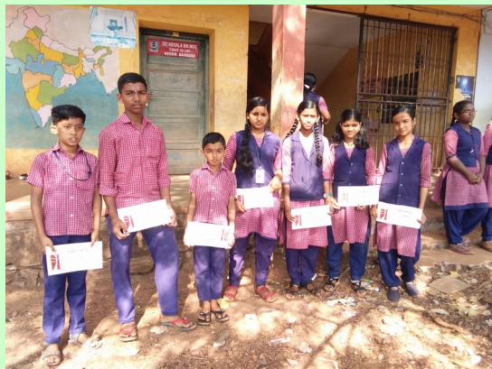
VIDYARANGAM DISTRICT LEVEL PARTICIPANTS