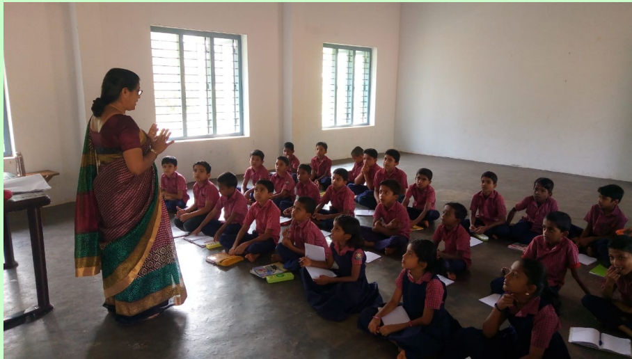
എൽ പി മലയാളത്തിളക്കം