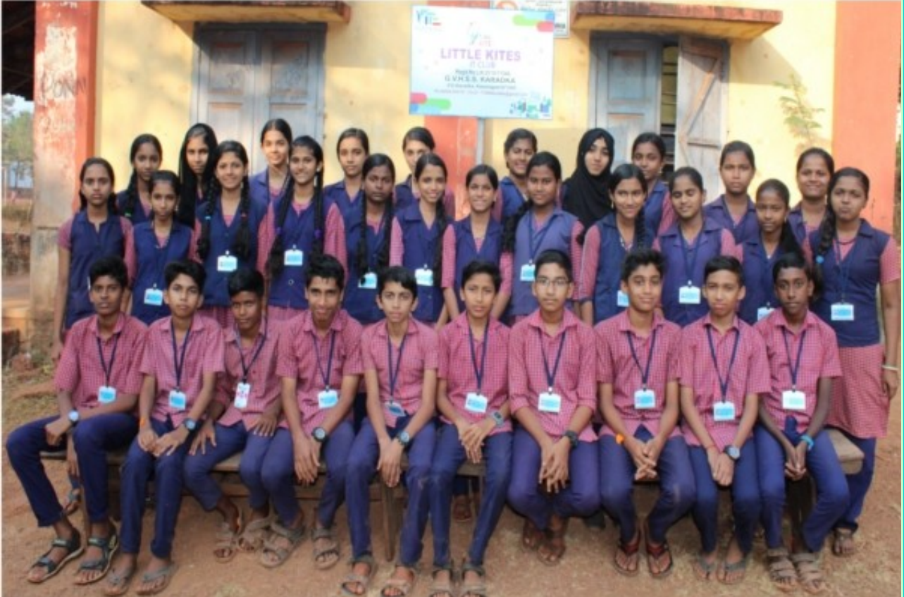
ലിറ്റിൽ കൈറ്റ്സ് യൂണിറ്റ് 2018-19