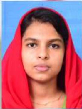
അജ്ഞ. എൻ 8B

2018- ആഗസ്റ്റിൽ ഉണ്ടായ പ്രളയദുരന്തത്തിന്റെ ഒരു അതിജീവന മാതൃകയായിരുന്നു ചേക്കുട്ടിപ്പാവകൾ. പ്രളയത്തിൽ തകർന്നടിഞ്ഞ ചേതമംഗലത്തുകാലത്തുകാരുടെ സ്വപ്നങ്ങൾ ചേക്കുട്ടിയിലൂടെ ഇതൾ വിരിയുകയായിരുന്നു. ചെളികയറി നശിച്ച തുണിതരങ്ങളിൽ നിന്ന് ഒരുലക്ഷത്തി ഇരുപതിനായിരത്തിൽ അധികം പാവകളെ അവർ നിർമ്മിച്ചു. അങ്ങനെ പല രാജ്യങ്ങളിലേക്ക് അവകയറ്റി അയച്ചു ലക്ഷങ്ങളുടെ വരുമാനമുണ്ടാക്കി കുട്ടികൾക്കും മറ്റും ചേക്കുട്ടി പെട്ടന് പ്രിയങ്കരമായി മാറി. അതിജീവനത്തിന്റെ സർഗ്ഗാത്മകരമായ ഒരു ഏടായി ചേക്കുട്ടി മാറി. ചേക്കുട്ടി വെറുമാരു പാവയല്ല്. മനുഷ്യത്വത്തിന്റെ ഉയർന്ന രൂപമാണ് പ്രളയത്തിന്റെ അതിജീവന മന്ത്രങ്ങളിൽ ചേക്കുട്ടിയും തലയുയർത്തി നിൽക്കുന്നു.