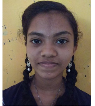
പവന VIII C

സ്നേഹത്തിൻ കൊടിപിടിക്കാം കൂട്ടരേ, സാഹോദര്യത്തിൻ കഥ പറയാം കൂട്ടരേ, അനീതിക്കെതിരെ അണിനിരക്കാം ഒത്തൊരുമയോടെ പൊരുതാം ഒരു നിമിഷം നിൽക്കണേ നമ്മെയോർത്തു കേഴുന്നൊരമ്മതൻ ആർത്തനാദം കേൾക്കണേ പാലുട്ടിവളർത്തി,കൈ പിടിച്ചു നടത്തി സ്നേഹത്തിൻ ആദ്യാക്ഷരം ഓതിതന്നൊരമ്മ നമ്മെ പോറ്റി വളർത്തിയോരച്ഛൻ കാലത്തിൻ പുസ്തകത്താൾ മറിയുമ്പോൾ നാളെ നമ്മളാകും ആ അമ്മ കാലം നമ്മെയാക്കും ആ അച്ഛൻ ഉയർന്നു വരുമൊരു തലമുറ നാളെ അവരെങ്ങനെയൊവു! പറയൂ കൂട്ടരേ,അവരെങ്ങനെയൊവണം?