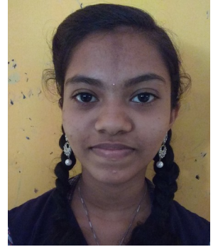
പവന VIII C

നേരെ പുലർന്നു. അടുക്കളയുടെ പണിത്തിരക്കിനിടയിൽ സുജ പെട്ടെന്ന് ഓർത്തു."ഗൗരിയുടെ കോളേജിൽ ഫീസ് ദിവസം കഴിഞ്ഞു . ആരുടെ കൈയിൽനിന്നും വാങ്ങും ? ജോലിക്കു പോകുന്ന വീട്ടിൽ ചോദിക്കാം " പെട്ടെന്ന് പണികളെല്ലാം ഒതുങ്ങി സുജ ഗൗരിയെ വിളിച്ചു . അവൾ എണീക്കാൻ കൂട്ടാക്കിയില്ല . "എല്ലാ ജോലിയും ഞാൻ തന്നെ ചെയ്യണം. കഷ്ടപ്പെട്ട് പഠിപ്പിച്ചു . ഡിഗ്രി ഫൈനൽ ഈയർ ആയിട്ടും അച്ഛനില്ലാത്ത വേദന ഞാനവളെ അറിയിച്ചിട്ടില്ല.എന്നിട്ടും രാവിലെ എണെയൊന്നു അടുക്കളയിൽ സഹായിക്കാൻ അവൾക്കു മനസ്സില്ല." പിറുപിറുത്തുകൊണ്ട് സുജ വീട്ടുജോലിക്ക് പോകുന്ന വീട്ടിലേക്കോടി. ജോലിയെല്ലാം കഴിഞ്ഞു ആ വീട്ടുകാരി ചേച്ചിയോട്.. രൂപ കടം ചോദിച്ചു. "സുജ എന്തിനാ എന്നും പൈസ മൂന്നേ വാങ്ങുന്നത്?-അവർ സുജയോട് ചോദിച്ചു ."മോളുടെ കോളേജിൽ ഫീസ് കൊടുക്കാനുള്ള ദിവസം കഴിഞ്ഞു. ഇത് ഫീസ് കൊടുക്കാനാണ്." അവൾ വിഷമത്തോടെ പ പറഞ്ഞു "ഇത്ര കഷ്ടപ്പെട്ട് പഠിപ്പിക്കുന്ന മകൾക്കു നിന്നോട് തരി സ്നേഹമില്ല." എന്റെ കടമ എനിക്ക് ചെയ്യാതിരിക്കാൻ കഴിയുമോ ചേച്ചി? " ചിരിച്ചു കൊണ്ട് സുജ പറഞ്ഞു എന്നിട്ടു അവരോട് യാത്ര പറഞ്ഞു യാത്രയായി.