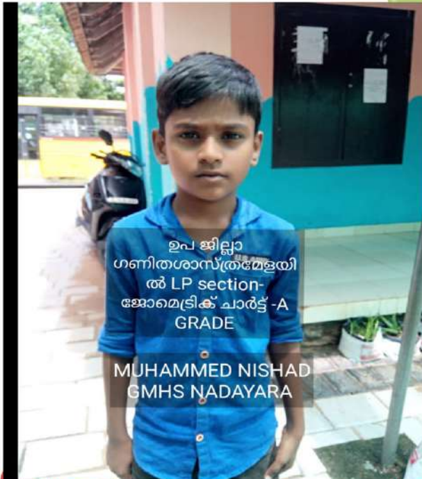
ഉപ ജില്ലാ ഗണിതശാസ്ത്രമേളയിൽ LP section- ജോമെട്രിക് ചാർട്ട് -A GRADE