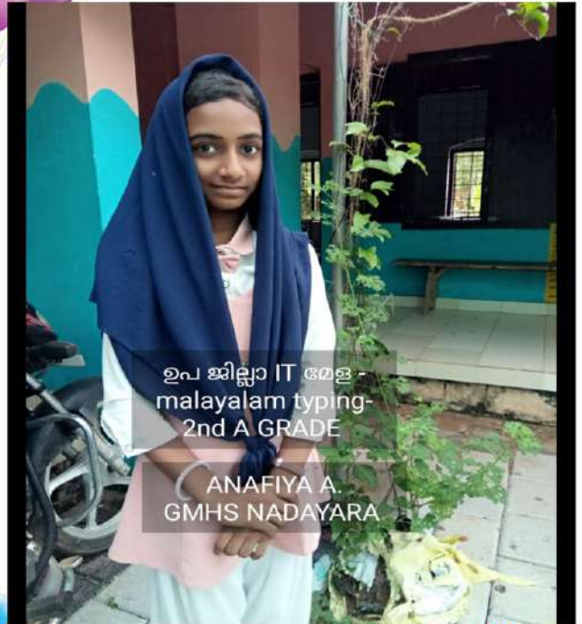
ഉപ ജില്ലാ IT മേള - malayalam typing- 2nd A GRADE