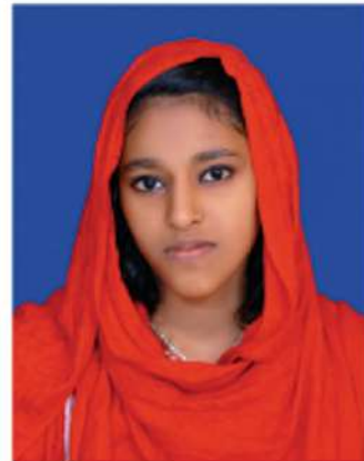
ഷർഹാത എം.എസ്(ഡിജിറ്റൽ മാഗസിൻ, എഡിറ്റർ)