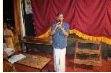
പ്രധാന അധ്യാപകൻ ജി വി എച്ച് എച്ച് എസ് എസ് വട്ടേനാട്

സാങ്കേതികയും സർഗാത്മകതയും രണ്ടും വേറെ വേറെയാണെന്നും ഒരിക്കലും കൂട്ടിമുട്ടാത്ത രണ്ടു സമാന്തരരേഖകൾ പോലെയാണെന്നുമായിരുന്നു ഈയടുത്ത കാലം വരെ നമ്മൾ ധരിച്ചിരുന്നത്.