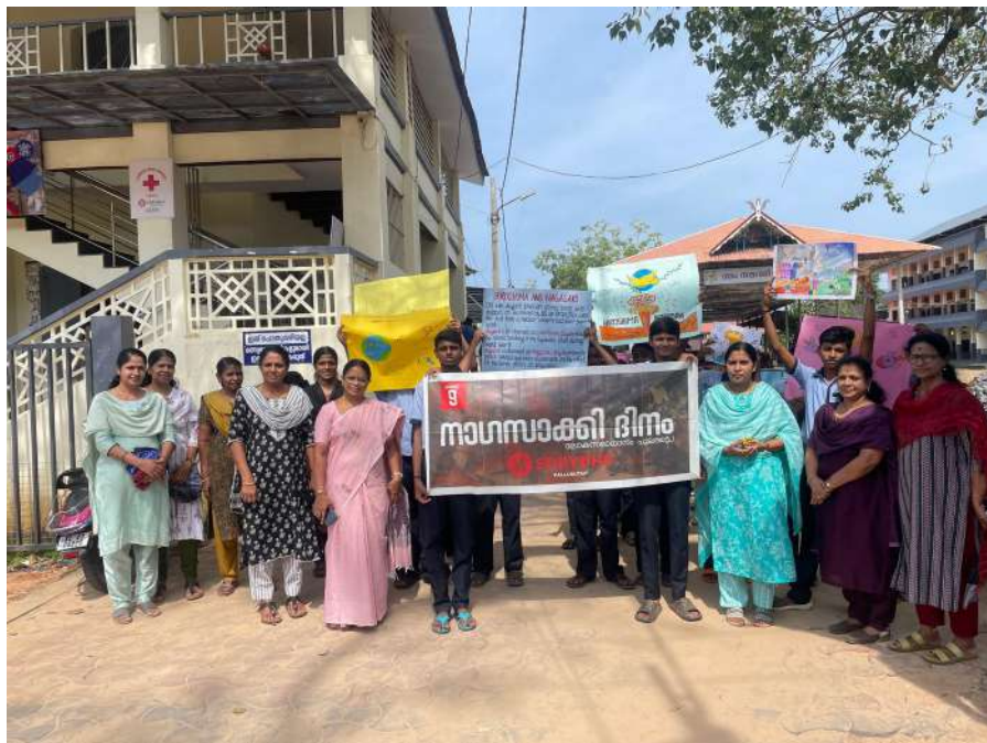
ഇനിയൊരു യുദ്ധം വേണ്ടേ വേണ്ടേ' എന്ന സന്ദേശവുമായി എസ്.ഡി.പി സ്കൂളിലെ വിദ്യാർത്ഥികൾ പള്ളുരുത്തിയിൽ സംഘടിപ്പിച്ച റാലി