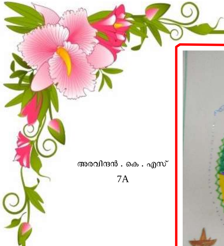
അരവിന്ദൻ . കെ . എസ് 7A