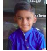
റിൻസ് പ്രതീഷ് 2 A