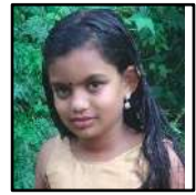
തീർത്ഥ സി .എസ്.