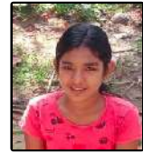
ഐശ്വര്യ . എസ് . എസ് 8A