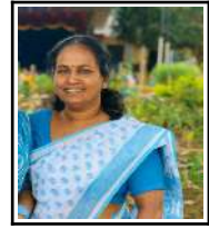
പുഷ്പ . എം . എ