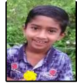
പ്രിൻസ് ഇമ്മാനുവൽ 4 A