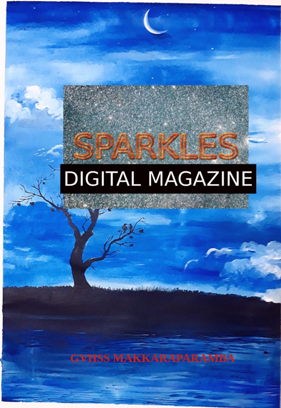
Figure 1: GVHSS MAKKARAPARAMBA