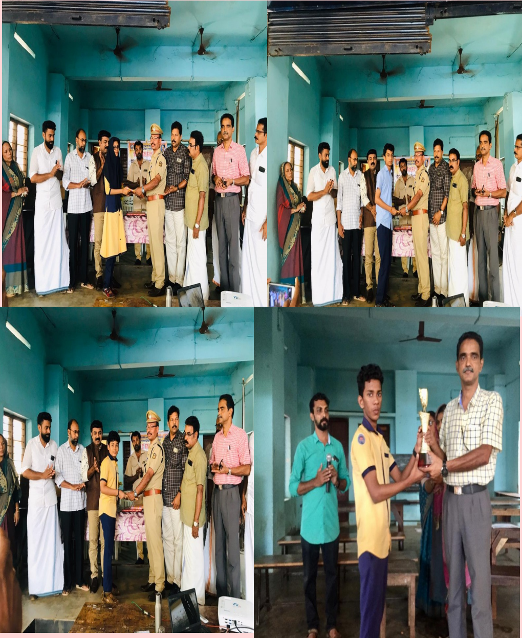
ഇവർ മക്കരപ്പറമ്പിന്റെ അഭിമാന താരങ്ങൾ