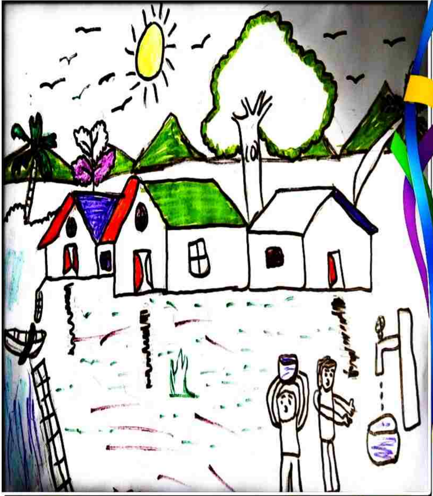
അമ്പിൻ സെബാസ്റ്റ്യൻ 5B