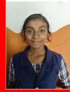
ANANDABHAIRAVI A 7 F