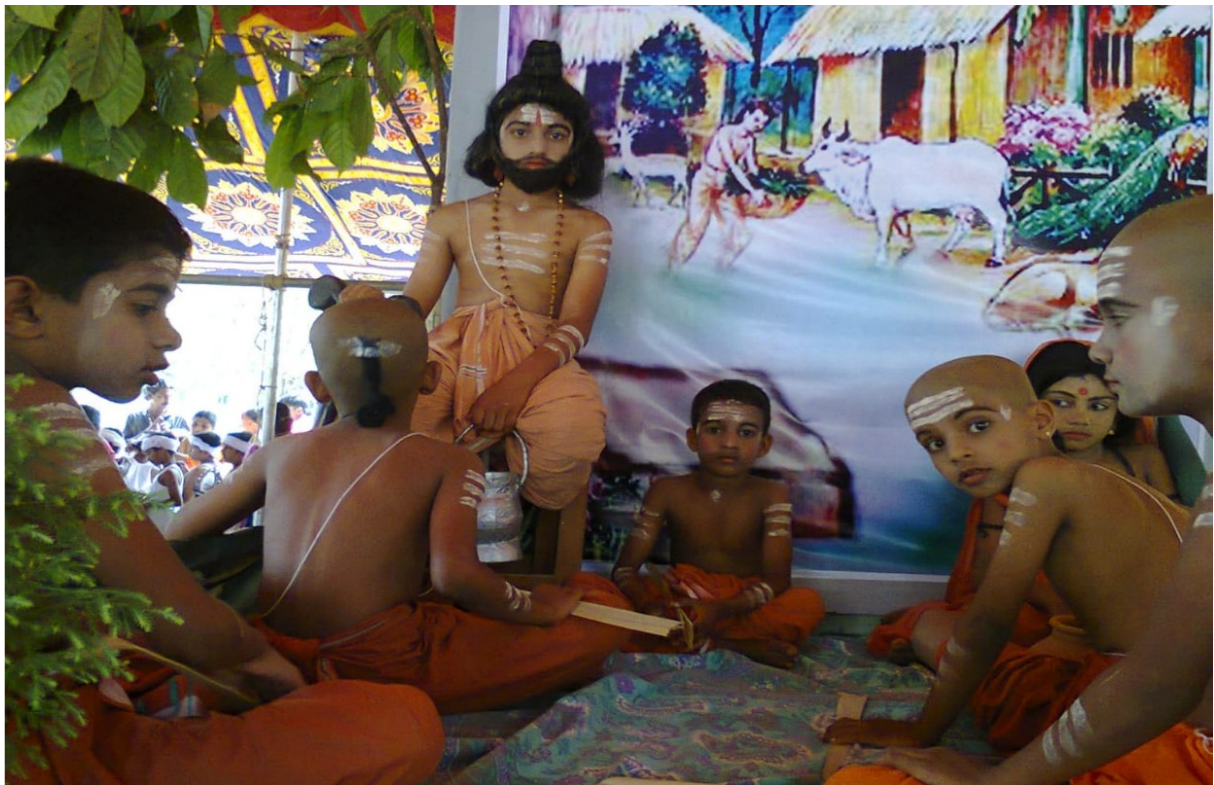
TABLEAU by LP Students