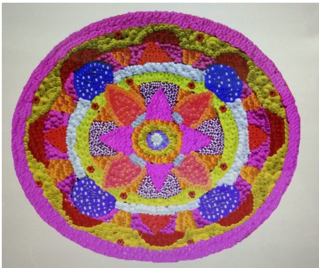
HFHSS MUTTOM, CHERTHALA