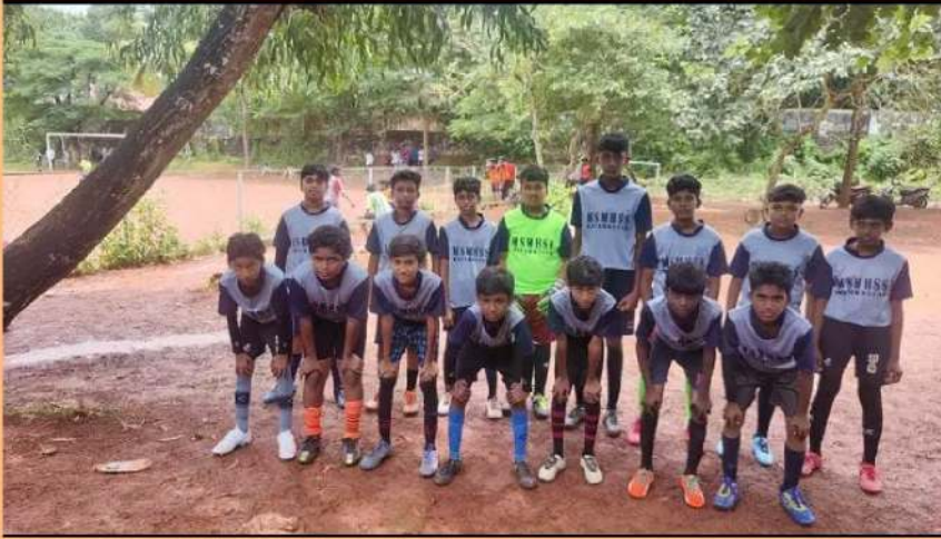
FOOT BALL TEAM