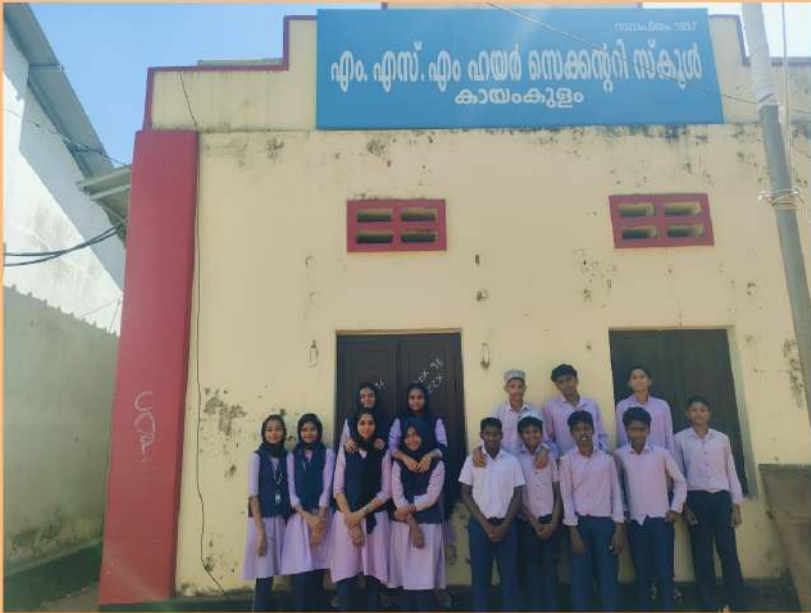
LITTLE KITES TEAM