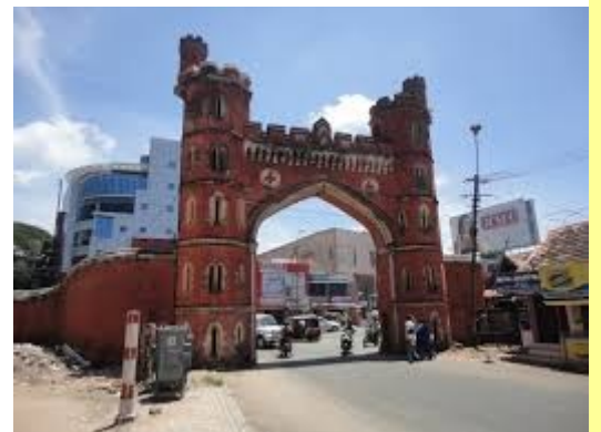
വിവരങ്ങൾ ശേഖരിച്ചത്- നാഫില സുൾഫിക്കർ

തിരുവിതാംകൂർ രാജാക്കന്മാർ നിർമ്മിച്ചതാണിത്