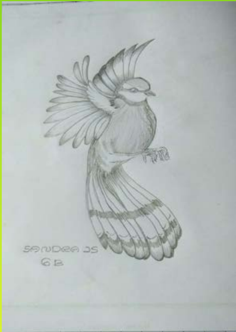
സാര 6 B