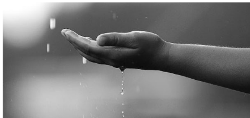
വെട്ടത്തൂർ ഗവൺമെന്റ് ഹയർസെക്കന്ററി സ്കൂൾ

നിൻ സ്വരമെത്ര മധുരം... കാതിൽ ചെറുകുളിരായ് നീ പൊഴിയവേ.. കണ്ണിൽ നീ നിറമേകി നെഞ്ചിൽ നീ കുളിരേകി എന്നിൽ പുതുമഴയായ് നീ പൊഴിയവേ.. നിൻ മൊഴിയിൽ നിറയും സ്നേഹം എൻ അമ്മയാം ഭൂമിക്കല്ലേ.. നിൻ കനവിൽ തെളിയും ചിത്രം നന്മയാം ഭൂമിയല്ലേ.. നിൻ വരവിൽ കുളിരണിയാൻ പൂൽനാമ്പും കൊതിക്കയല്ലേ.. നീ വന്നാൽ സ്നേഹഭൂമി പച്ചപ്പുടുവ ചാർത്തീടുകില്ലേ ഭൂമിയിൽ പെയ്തിറങ്ങും ദേവതയേ എന്നിലിഷ്ടം നിറച്ചതും നീയേ.. എന്റെ മിഴിനീർ തുടച്ചതും നീയേ.. നെഞ്ചിൽ കുത്തിയെരിയുന്ന നോവിലും എന്നിൽ സാന്ത്വനമേകിയതും നീയേ..