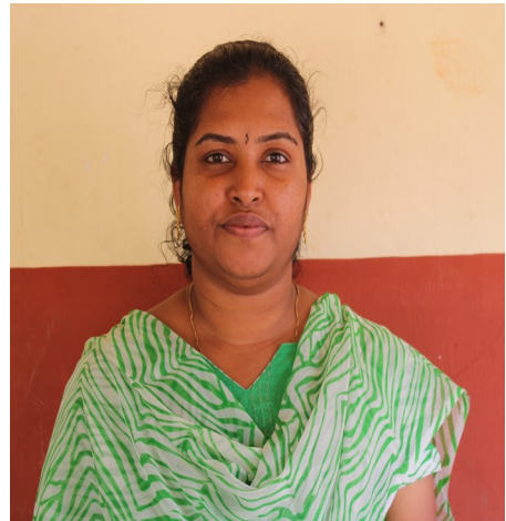
ഷൈജി. എ HST മലയാളം

ഇത്തിരി പോന്നൊരാ ഓമൽകിടാവിനെ ഇത്രയും നേരമായ് കാണാനില്ല ഇന്നതിരാവിലെ പുത്തനടുപ്പിട്ട് പുഞ്ചിരിതൂവിക്കൊണ്ടമ്പലത്തിൽ അമ്മയോടൊത്തുനൂ "എൻ പിറന്നാളല്ലെ പായസം കൂട്ടിട്ട് ചോറുണ്ണണം എൻ പ്രിയ കൂട്ടർക്കു നൽകുവാനായ് നേരത്തെ ക്ലാസിൽതന്നെത്തവേണം" വീടിനയൽപക്കത്തൊക്കെ തിരിഞ്ഞു കൊണ്ടമ്മയുമച്ചനും നാട്ടുകാരും ഇത്തിരി പോന്നൊരാ ഓമൽകിടാവിനെ