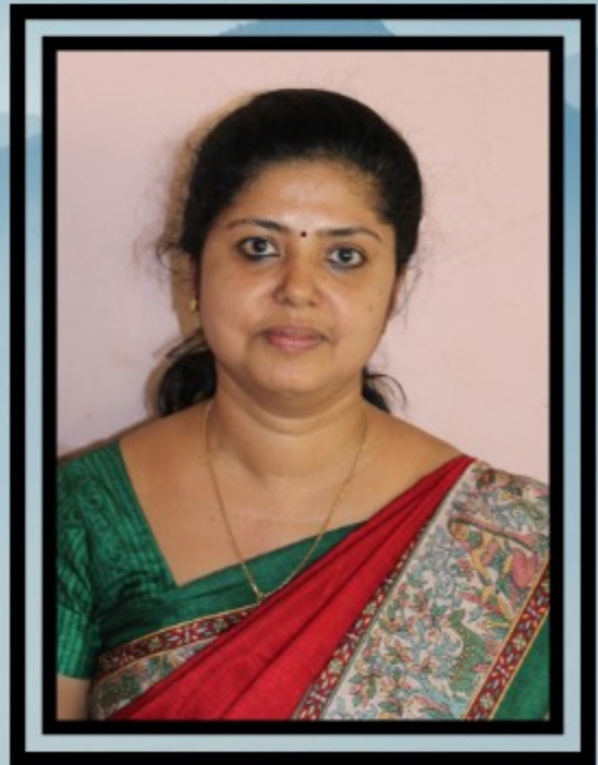
ബിജിഡേവിസ് പി കൈറ്റ് മിസ്ട്രസ്സ്