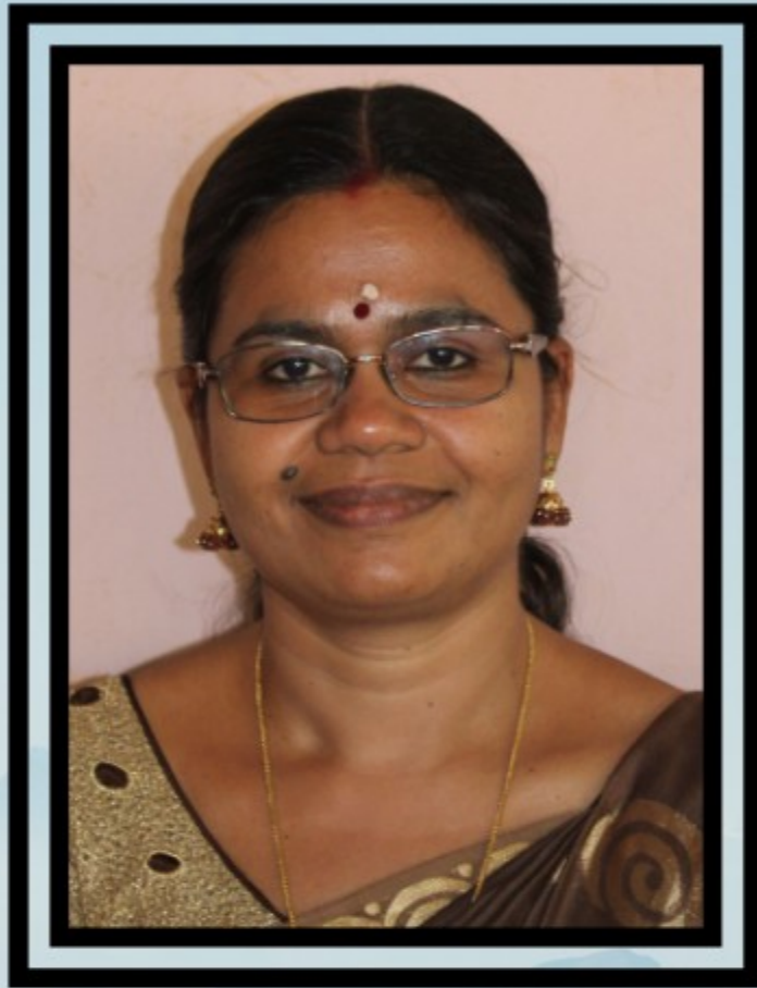
പത്മ എൻ എസ് ഐ ടി സി