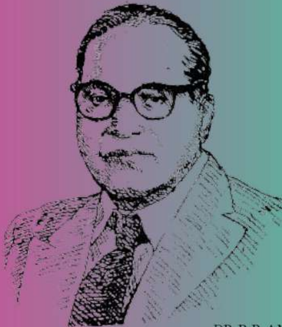
- DR.B.R AMBEDKAR

“If I find the constitution being misused, I shall be the first to burn it.”