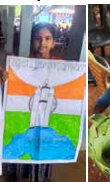
ആയിഷ റയ കെ.കെ പനയോല കൊണ്ടുള്ള ഉൽപ്പന്നം A Grade