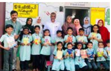
സ്കൂൾ ലൈബ്രറിയിലേക്ക് ഒരു കുട്ടി ഒരു പുസ്തകം.