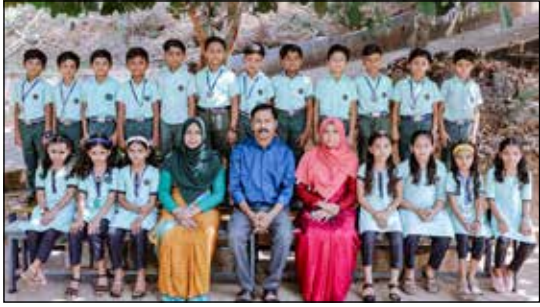
Class : 2 A