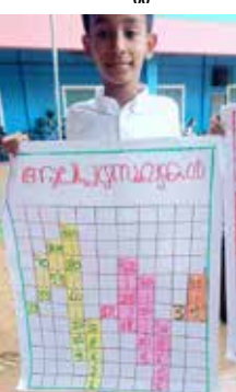
ഹാദി അമൻ നമ്പർ ചാർട്ട് A Grade