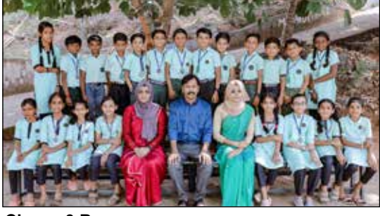
Class : 3 B