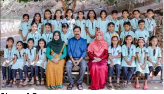
Class : 2 B