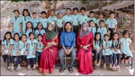
Class : 1 A