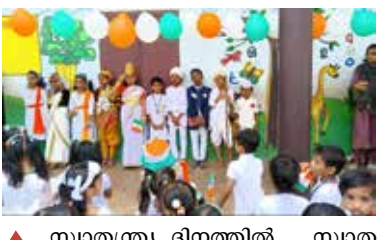
സ്വാതന്ത്ര്യ ദിനത്തിൽ സ്വാതന്ത്ര്യസമര സേനാനികളുടെ വേഷം അണിഞ്ഞ കുരുമ്പുകൾ.