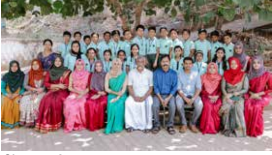
Class : 4 A

പറഞ്ഞറിയിക്കാൻ പറ്റാത്തതാണ്. വളരെ സ്നേഹത്തോടെ പെരുമാറുന്ന പ്രധാന അധ്യാപകനും അതിലേറെ വാത്സല്യത്തോടെ കുട്ടികളെ പരിഗണിക്കുന്ന ടീച്ചേഴ്സും എന്റെ മനസ്സിൽ പതിഞ്ഞു.