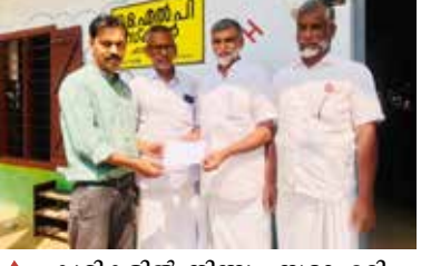
കുട്ടികളിൽ നിന്നും സമാഹരിച്ച 6000/ രൂപ എടവണ്ണ പാലിയേറ്റീവ് കെയർ യൂണിറ്റിലേക്ക് കൈമാറുന്നു.