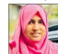
നാഫില MTA വൈസ് പ്രസിഡന്റ്