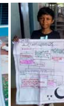
അദിരുപ്പ് ഇ ടി ഇഷ മെഹറിൻ വി - സയൻസ് ചാർട്ട് A Grade