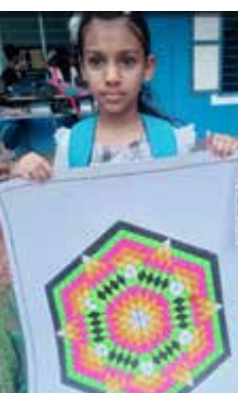
ഷെസബിയ്യ. പി ജോമുദ്രിക്കൽ ചാർട്ട് A Grade