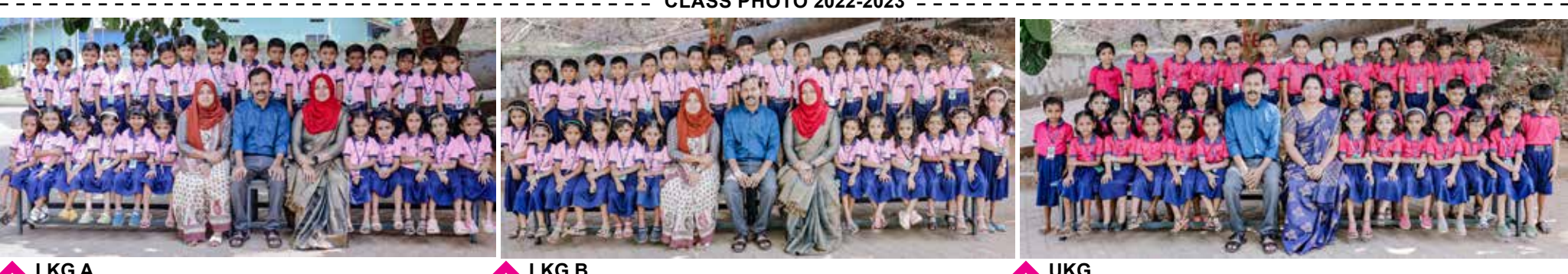
LKG A LKG B UKG