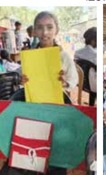
മിസ്ഹബ്. യു. വിവിധതരം നൂല് കൊണ്ടുള്ള പാറ്റേൺ A Grade