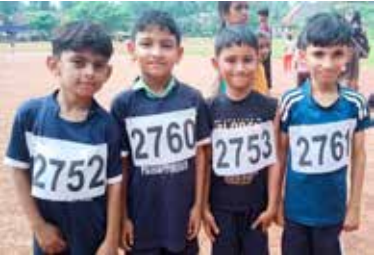
മഞ്ചേരി സബ്ജില്ലാ കായിക മേള. 4 x 50 mtr Shuttle Relay (Mini Boys)