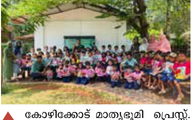
കോഴിക്കോട് മാതൃഭൂമി പ്രൈന്റ് ഫീൽഡ് ട്രിപ്പ്