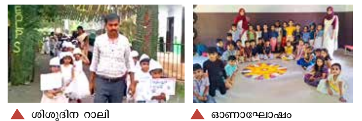
ശിശുദിന നാലി, ഓണാഘോഷം

SPOT ADMISSION LKG, UKG, 1st to 4th Std. (English & Malayalam Medium) 04/03/2024 Monday - 2 pm to 4pm Ph: 9847847045 (HM)