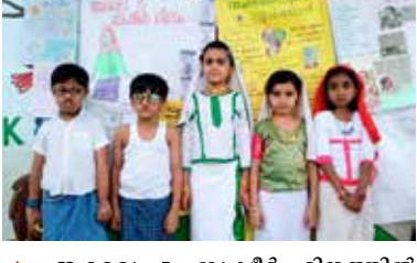
ജൂലൈ 5 ബഷീർ ദിനത്തിൽ കഥാപാത്രങ്ങളായി വേഷമണിഞ്ഞവർ.