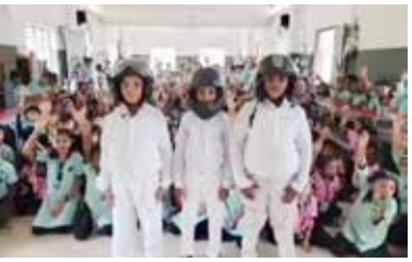
ചന്ദ്രദിനത്തിൽ ബഹിരാകാശ യാത്രികരുടെ വേഷമണിഞ്ഞ കുട്ടികൾ.