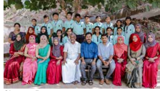
Class : 4 B

ടൊപ്പം സ്കൂളിലെ പരിമിതികളും ഞാൻ മനസ്സിലാക്കി. മുന്നാം ക്ലാസിൽ എത്തിയപ്പോൾ എന്റെ ഉപ്പയോട് ഞാൻ പറഞ്ഞു.