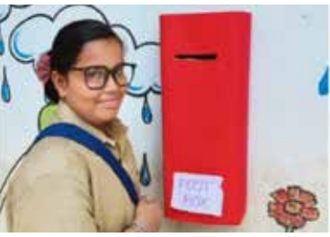
സ്കൂളിൽ ഒരു പോസ്റ്റ് ഓഫീസ്.

SPOT ADMISSION LKG, UKG, 1st to 4th Std. (English & Malayalam Medium) 04/03/2024 Monday - 2 pm to 4pm Ph: 9847847045 (HM)