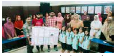
ഭാഷോത്സവത്തിന്റെ ഭാഗമായി കുട്ടികൾ തയ്യാറാക്കിയ അക്ഷര മൊട്ടുകൾ കുട്ടിപ്പുത്രത്തിന്റെ പ്രകാശനം ഹെഡ്മാസ്റ്റർ നിർവഹിക്കുന്നു.