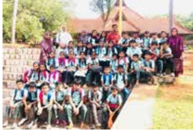
കേരള കലാമണ്ഡല സന്ദർശനം.