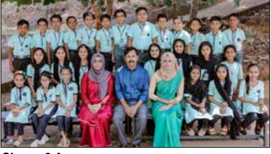
Class : 3 A