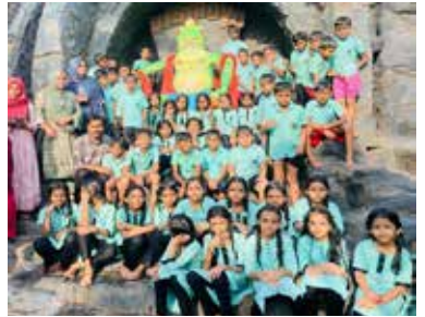
കണ്ണൂർ ഭാഗത്തേക്ക് നടത്തിയ പഠനയാത്ര