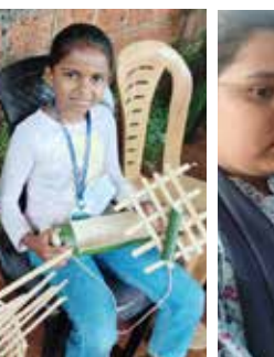
തൗബ വി പി - ഇഴ മുള കൊണ്ടുള്ള ഉൽപ്പന്നം മൂന്നാം സ്ഥാനം A Grade