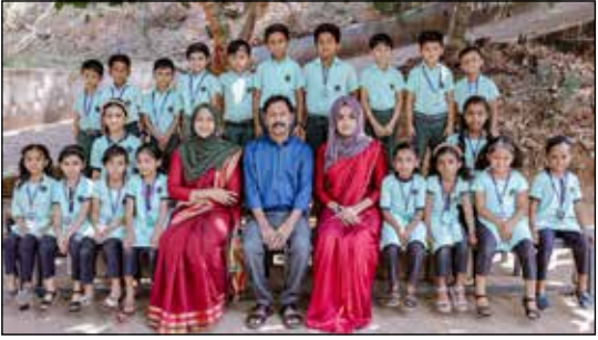
Class : 1 B