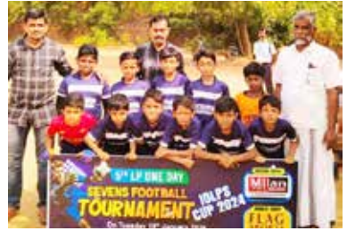
സ്കൂൾ ഫുട്ബോൾ ടീം.