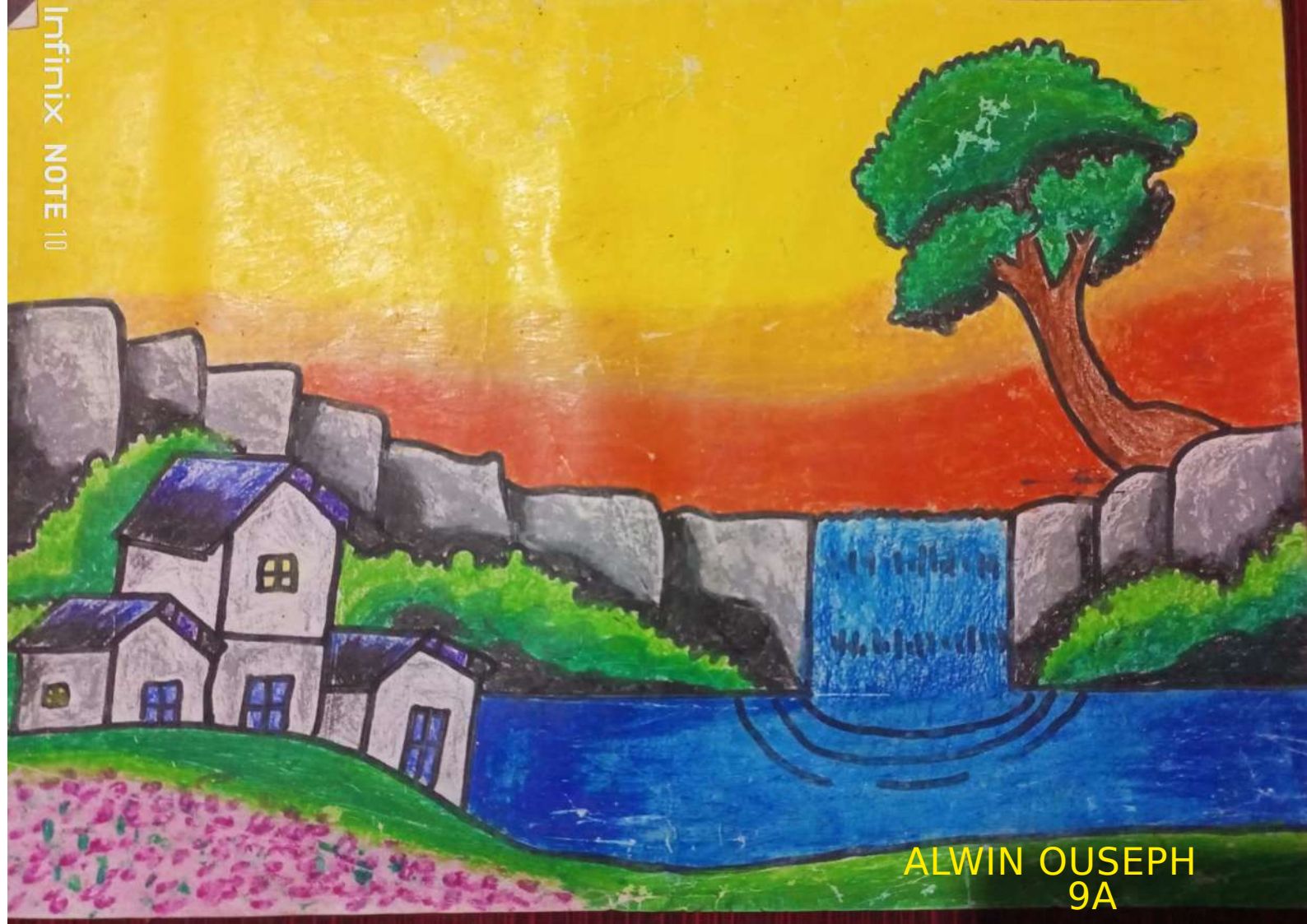
ALWIN OUSEPH 9A