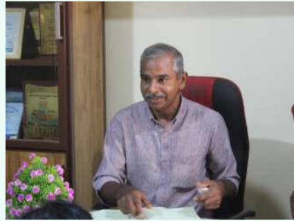
സ്റ്റേഹപുർച്ചും നിങ്ങളുടെ ഹെഡ്മാസ്റ്റർ

നമ്മുടെ വിദ്യാലയത്തിന് അഭിമാനമാകുന്ന തരത്തിൽ(മുഴുവില്ല) എന്ന ഡിജിറ്റൽ മാഗസിൻ പുറത്തിറങ്ങുവാൻ ലിറ്റിൽ കൈറ്റ്സിലെ കുട്ടികൾ തയ്യാറായതിൽ സന്തോഷിക്കുന്നു. നിങ്ങളുടെ കർമ്മോത്സുകതയേയും നല്ല ചിന്തകളേയും അഭിനന്ദിക്കുന്നു. ദാവിയീലും വിജയം നേടട്ടെ.