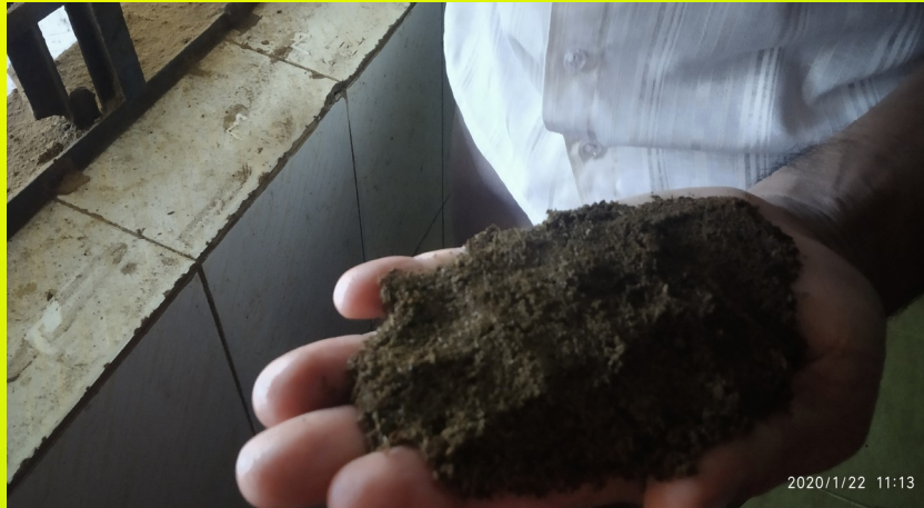
INDUSTRIAL VISIT – ERUMAD TEA FACTORY LITTLE KITES , SMCHSS