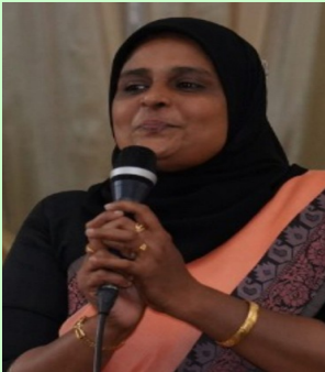
സക്കീന വി.എ എച്ച്. എസ്. എ മലയാളം