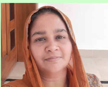
ABIDA C A HSA HINDI