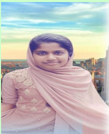
അൽ ഷിഫാന 8 A

സ്നേഹം പ്രകടിപ്പിക്കുകയും മറ്റുള്ളവർക്ക് നമ്മളോട് ദേഷ്യം ഉണ്ടെങ്കിൽ അവരെ സ്നേഹിച്ച് നമ്മളോട് ഉള്ള ദേഷ്യം മാറ്റുകയാണ് വേണ്ടത്. വല്ലാതെ ദേഷ്യം കൂട്ടുകയല്ല വേണ്ടത്. മറ്റുള്ളവരെ കാണുമ്പോൾ മുഖത്ത് ഒരു പുഞ്ചിരി വേണം. അതുണ്ടെങ്കിൽ നമ്മുടെ ബന്ധങ്ങൾ നിലനിൽക്കും പക്ഷെ ഇപ്പോഴത്തെ തലമുറക്ക് മുഖത്ത് നോക്കാനുള്ള സമയം ഉണ്ടോ? എല്ലാവരും വളരെ തിരക്കിലാണ്. ഒരു ജോലിയും ഇല്ലെങ്കിൽ പോലും ഫോൺ എന്നൊരു സാധനം ഉള്ളതുകൊണ്ട് എല്ലാവരും വളരെ തിരക്കിലായിരിക്കും. പലപ്പോഴും നമ്മുടെ ബന്ധങ്ങൾ കുറയാനുള്ള കാരണം മൊബൈൽ ഫോണാണ്. അതുകൊണ്ട് നമ്മൾക്ക് ഉപകാരം ഉണ്ട് .പക്ഷെ കുറപ്പെടുത്തേണ്ടത് നമ്മളെ തന്നെയാണ്. ഒരു ദിവസം മുഴുവനും ഇതിൽ തന്നെ നോക്കിയിരിക്കുന്നവരുണ്ട്. അവരാണ് കുറ്റക്കാർ .അല്ലാതെ ആവശ്യത്തിനത്രമാത്രം നോക്കുന്നവരെ കുറപ്പെടുത്തേണ്ടതില്ല. പരസ്പരം സ്നേഹ ബന്ധം നിലനിർത്താൻ നാട്ടിൽ എല്ലാവരും ശ്രമിക്കണം .എന്നാൽ നമ്മുടെ ഈ ലോകവും ശാന്തിയും സമാധാനവും ഉള്ളതായി മാറും. നമ്മുടെ ലോകം നന്നാവാൻ നമ്മൾ വിചാരിച്ചാൽ സാധിക്കും എന്നു പറഞ്ഞുകൊണ്ട് ഞാൻ എന്റെ വാക്കുകൾ അവസാനിപ്പിക്കുന്നു. നന്ദി നമസ്കാരം.