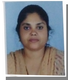
ടി എം ലത ( HSA Mal )