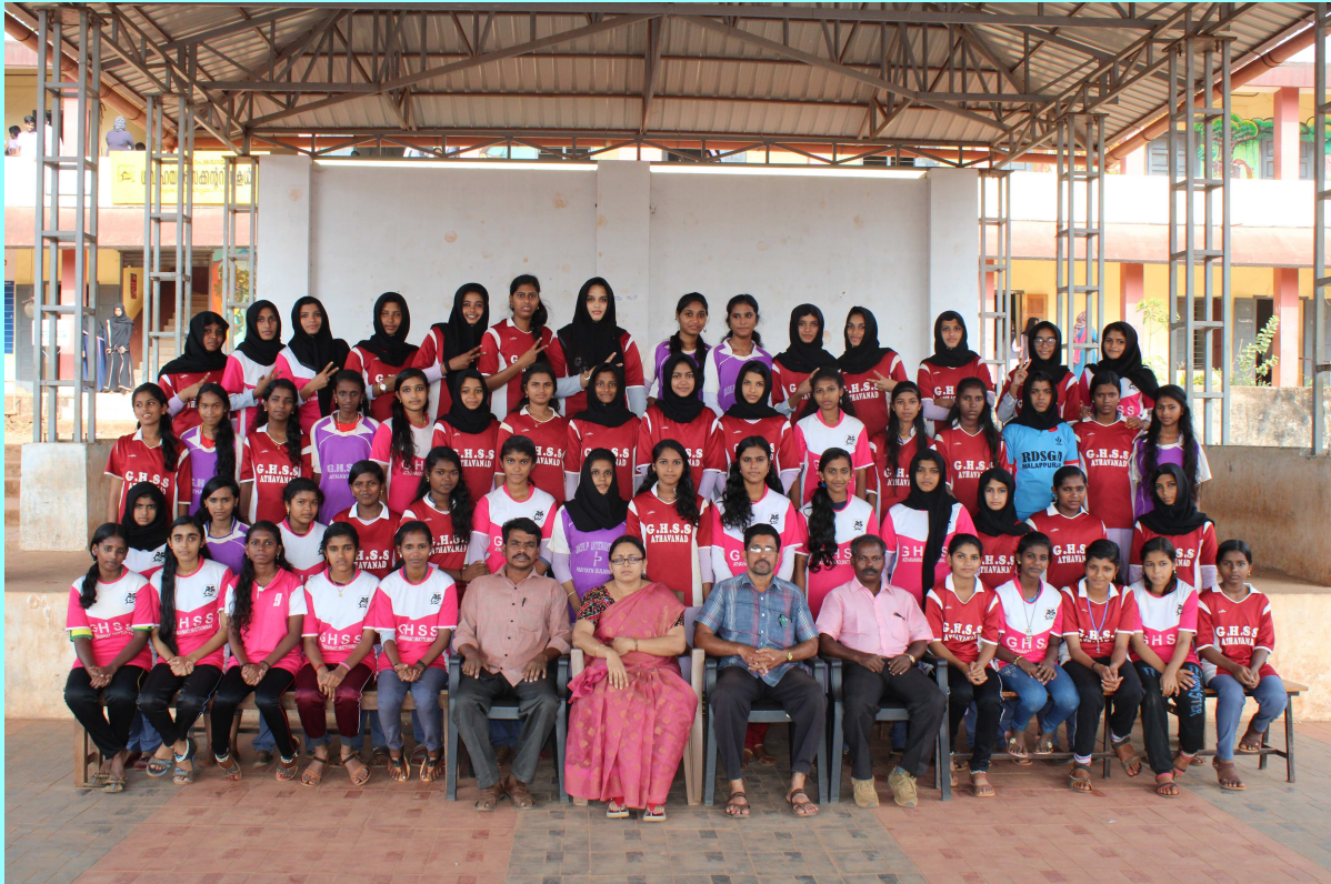
സ്കൂളിലെ സ്പോർട്സ് അംഗങ്ങൾ (Girls)