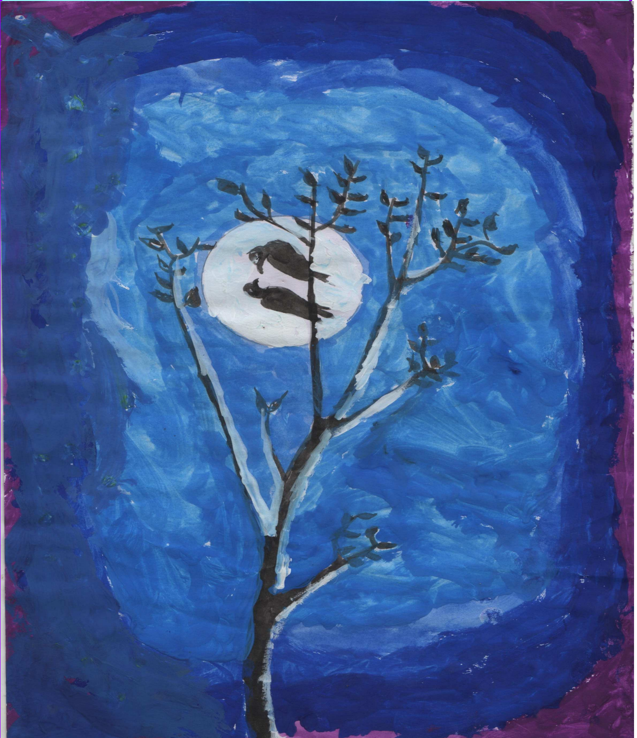
സബീൻ ലാൽ 9-A