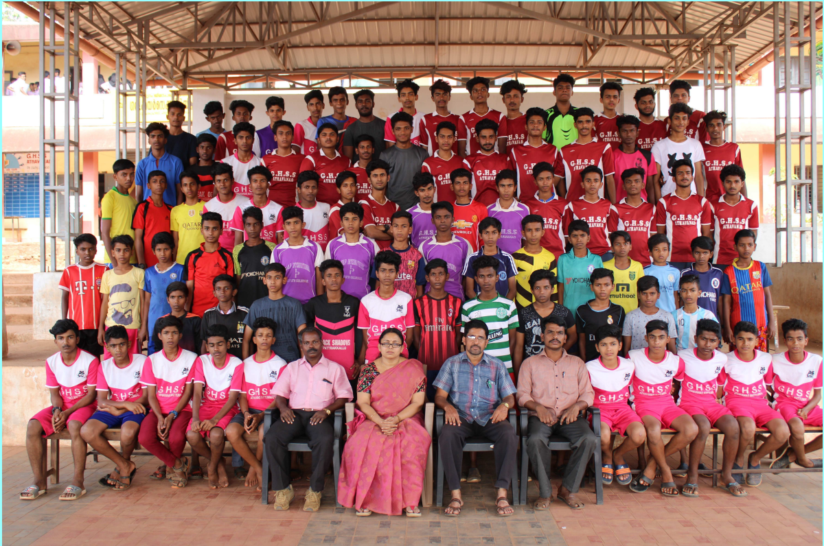
സ്കൂളിലെ സ്പോർ്സ്ടീംഗങ്ങൾ (Boys)