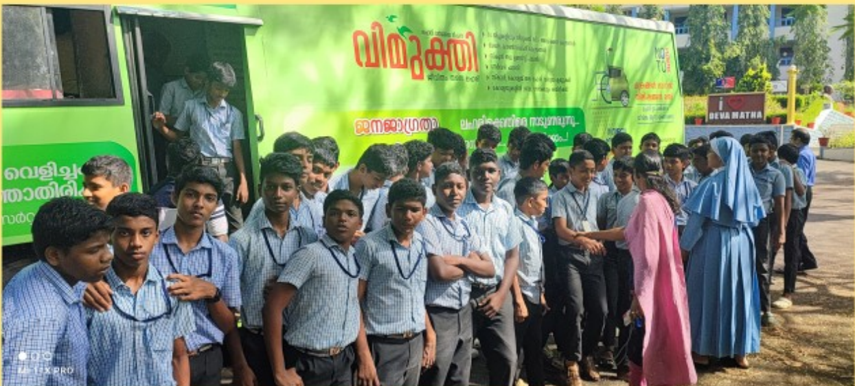
എക്സ്പ്രസ് വകുപ്പ് നടത്തിയ ലഹരിക്കെതിരെയുള്ള ബോധവൽക്കരണ പരിപാടിയിൽ സെന്റ് മേരീസിലെ കുട്ടികൾ .

ലഹരി വസ്തുക്കൾ നമ്മുടെ ശാരീരികവും മാനസികവുമായ ആരോഗ്യത്തിന് വളരെ ദോഷകരമാണ്. അവ നമ്മുടെ ശരീരത്തെ ദുർബലപ്പെടുത്തുകയും തലച്ചോറിന്റെ പ്രവർത്തനത്തെ ബാധിക്കുകയും ചെയ്യും. ലഹരിക്ക് അടിമകളാകുന്നവർ പഠനത്തിലും ജോലിയിലും പിന്നോക്കം പോകുകയും സാമൂഹികമായി ഒറ്റപ്പെടുകയും ചെയ്യും.