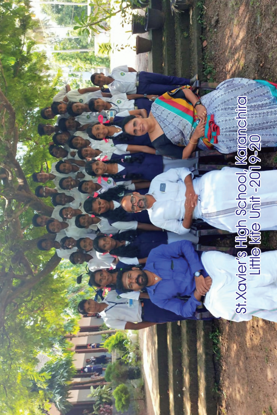
St. Xavier's High School, Karanchira Little Kite Unit -2019-20