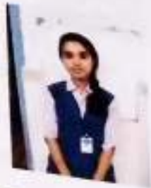
TRESASANTHOS X B

ഭൂതകാലത്തെ തിരിഞ്ഞ് നോക്കുമ്പോൾ സെന്റ് സെബാസ്റ്റ്യൻസ് സ്കൂളും അദ്ധ്യാപകരും എന്റെ മനസ്സിൽ ഒരു മായാത്ത ഓർമ്മയായി എന്നിൽ അലിഞ്ഞുചേരും.