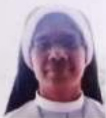
SR HENI MDL MANUEL