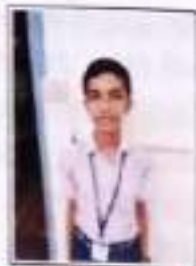
SAIN AUGUSTINE 9.C

എന്ന് കവി പറഞ്ഞത് എത്ര സത്യമാണ്. കേരളം ഇന്ന് പല കാര്യങ്ങളും അഭിരുചി കഴിഞ്ഞിട്ടുണ്ട് ഈ പ്രശ്നങ്ങളിലെയും, അതിനെ എങ്ങനെ മറികടക്കാമെന്നും, ഈ പ്രശ്നങ്ങൾക്ക് കാരണമെന്നും ഇതിലൂടെ കാണാൻ സാധിക്കും.