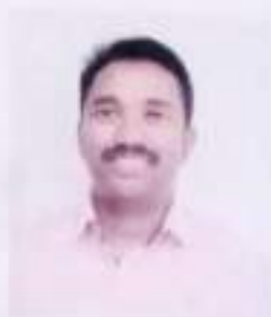
AJI V J