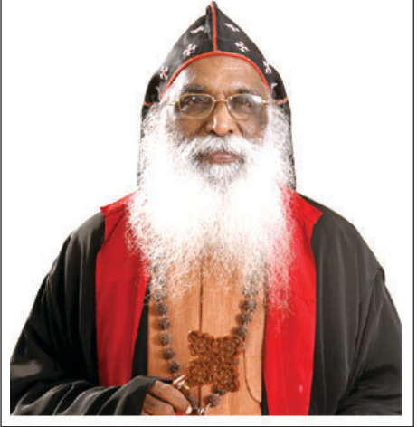
മലകര മാർത്തോമ്മാ സുറിയാനി സഭ പരമാദ്ധ്യക്ഷൻ അഭിവാന്ദ്യ ഡോ. ജോസഫ് മാർത്തോമ്മാ മെത്രാപ്പോലീത്താ തിരുമേനി

ഓരോ വിദ്യാർത്ഥിയും ഒരു പച്ചക്കറി നട്ട് പരിപാലിക്കുക, അതിൽനിന്നു ലഭിക്കുന്ന വിളവ് സ്കൂളിലെത്തിച്ച് വിളവെടുപ്പ് ഉത്സവത്തിൽ പങ്കെടുത്ത് വിലപന നടത്തി കിട്ടുന്ന പണം സഹപാഠികൾക്കു തന്നെ പദ്ധതിക്ക് നൽകുക എന്നതാണ് പരിപാടി. സ്കൂളിലെ 1300 വിദ്യാർത്ഥികളെയും രക്ഷിതാക്കളെയും സാക്ഷി നിർത്തി ഒരു വിദ്യാർത്ഥിക്ക് പച്ചക്കറിച്ചെടി നൽകി എം.പി. ഉദ്ദേശ്യം നിർവ്വഹിച്ചു. ഓരോ വിദ്യാർത്ഥിയും പച്ചക്കറി ചെടിയുടെ പരിപാലന ഡയറി തയ്യാറാക്കേണ്ടതുമാണ്.