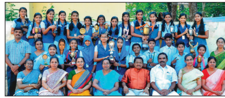
യു. പി. വിഭാഗം

കലാകായിക-ശാസ്ത്ര-പ്രവർത്തിപരിചയമേഖലകളിൽ നിരവധി നേട്ടങ്ങളുടെ മഹത്തായ പൈതൃകം നില