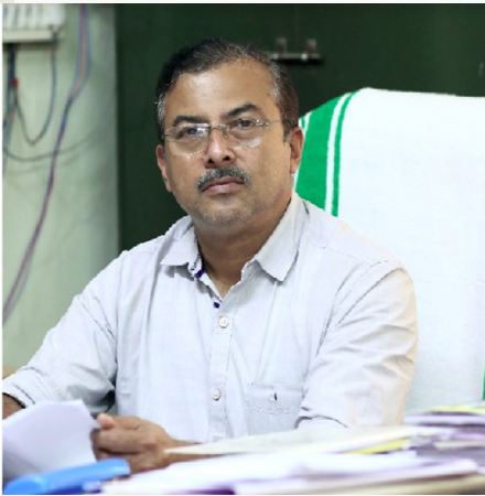
SIJU CS HEADMASTER C.K.M H.S.S KORUTHODU