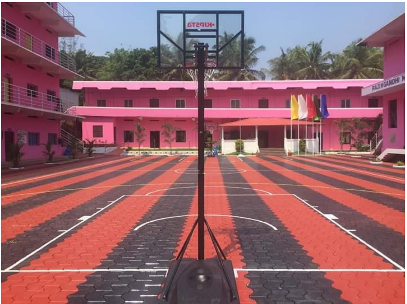
Little Kites, C H S S , Thalavil