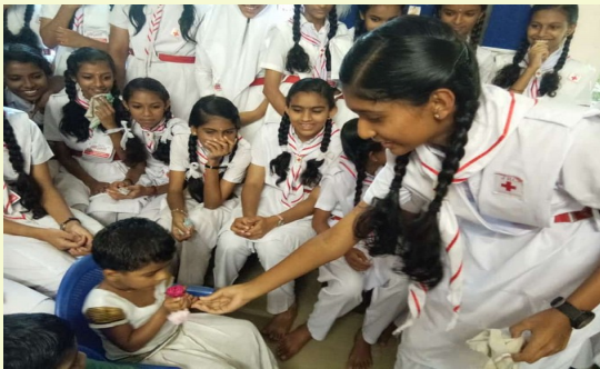
ജെ ആർ സി പ്രവർത്തനങ്ങളിലൂടെ