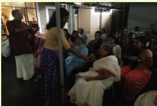
VISITING OLD-AGE HOME