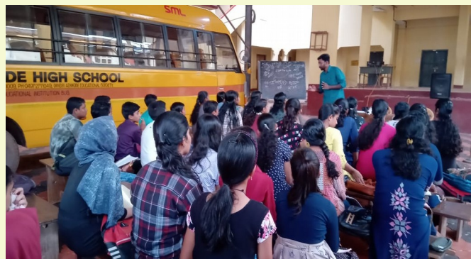
CIVIL SERVICE FOUNDATION CLASS