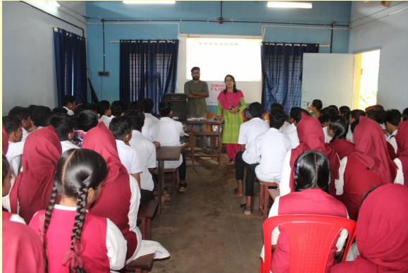
A CLASS ON FILM TECHNOLOGY