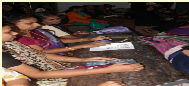
QR CODE AWARENESS CLASS