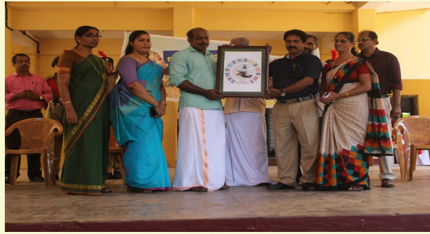
PAPPINISSERI SUB-DIST KALOLSAVAM