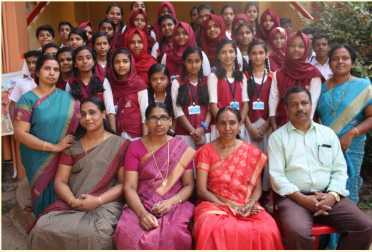
LITTLE KITES CLUB 2018-19