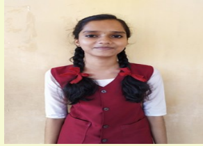
ARUNIMA T X I

ഇതാരാ? അയാൾ പിറകോട്ട് നോക്കി. അവിടെ ആരെയും കാണുന്നില്ല ഏത് അവർ ചോദിച്ചു? അയാൾ ഒന്ന് പരുങ്ങി പോയി. അകത്തേക്ക് വാ എന്ന് വൃദ്ധൻ പറഞ്ഞു . പെട്ടെന്ന് വൃദ്ധന് ശ്വാസം മുട്ടൽ വന്നു. അവർ എന്താ എന്ന് ചോദിച്ചു അപ്പോഴേക്കും അദ്ദേഹം മരിച്ചു. ഒരു പെട്ടെന്നുള്ള മരണം. അപ്പോൾ അവർ മക്കളെ വിളിച്ചു പറഞ്ഞു. കല്യാണം കഴിഞ്ഞു ഭാഗ്യം അവർ പെട്ടെന്ന് തിരിച്ചു വരാൻ തയ്യാറെടുപ്പുകൾ നടത്തി. ആ വന്നത് ചിലപ്പോൾ അദ്ദേഹത്തെ കൊണ്ടുപോകാൻ വന്നയാളാവാം. അതായിരിക്കാം ഇനി എപ്പോഴും അദ്ദേഹത്തിന്റെ കൂടെ ഉണ്ടാകും എന്ന് ആ അതിഥി പറഞ്ഞത്. അവരുടെ ജീവിതത്തിലെ അവസാനത്തെ അതിഥി. ദൈവം.