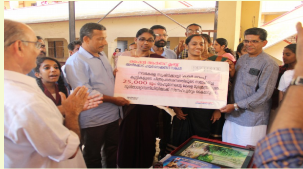
FINE ARTS CLUB