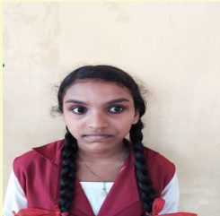
നിയ കെ VIII J

ഉം ശരി വാ മക്കളേ എന്ന് പറഞ്ഞ് അവൾ അകത്തേക്ക് കയറി പോയി പോയി പാവം ആ മക്കൾ അമ്മയെ സങ്കടത്തോടെ നോക്കി.അങ്ങനെ ആ അമ്മ വീണ്ടും വൃദ്ധസദനത്തിലേക്ക്. വരാമെന്ന് പറഞ്ഞിട്ട് പോയ തന്റെ മകന്റെ വാക്കും വിശ്വസിച്ച അമ്മ കാത്തിരിക്കുകയാണ്.