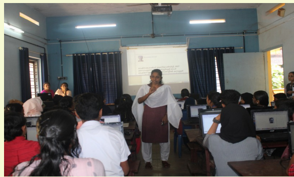
LITTLE KITE CAMP