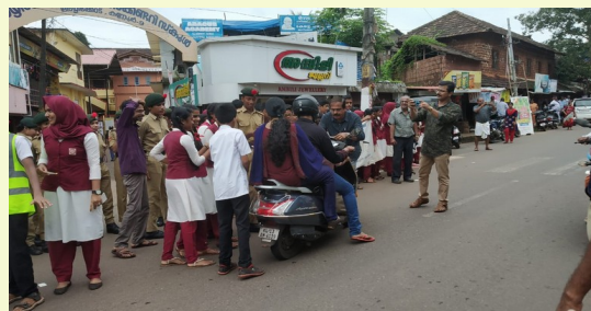
TO WEAR HELMET AND SAVE YOUR LIFE