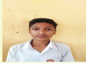
ARJUN K VIII L

അതിനാൽ ഈ പാവയെ ആരുടെ കയ്യിൽ നിന്നാണ് എടുത്തത് അവൻറെ കയ്യിൽ തന്നെ കൊടുത്തേക്ക്. ഇനി ഇത്തരം പ്ലവർത്തനം നീ ചെയ്യരുത്. അവൻ കുറ്റബോധം തോന്നി. അവൻ പിറ്റേന്ന് തന്നെ പാവ എടുത്ത് സ്കൂളിൽ പോയി അപ്പുവിന്റെ കയ്യിൽ കൊടുത്തു. അങ്ങനെ കാർയം ഒക്കെ പറഞ്ഞപ്പോൾ അപ്പുവിന് മനസ്സിലായി. പിന്നീടുള്ള ദിവസം രണ്ടുപേരും ഉറ്റ ചങ്ങാതിമാരായി സ്കൂളിൽ പഠിച്ചു.