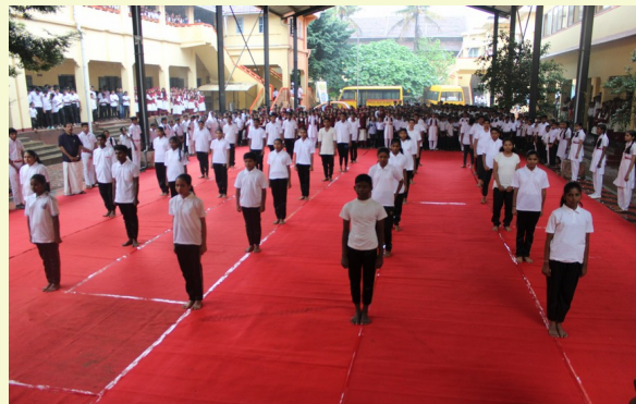
YOGA DAY CELEBRATION