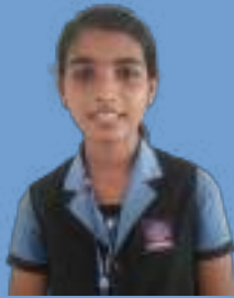
സൂര്യഗായത്രി അഞ്ച് ബി