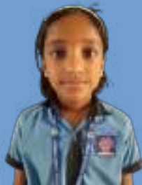
അന്ന കാതറിൻ മൂന്ന് എ

വേനൽ വന്നു പൂക്കൾ വറ്റി പൂല്ല് കരിഞ്ഞു, ഇല പൊഴിഞ്ഞു ചെടിയുണങ്ങി പക്ഷികൾ പറന്നുപോയി കൂട്ടി ആകാശത്തേക്ക് നോക്കി മേഘങ്ങളോട് ചോദിച്ചു ഒന്ന് പെയ്തിറങ്ങുമോ?