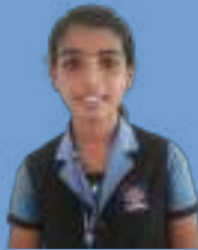
സൂര്യഗായത്രി എ അഞ്ച് ബി