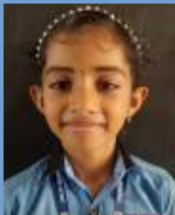
ആരാധ്യ ജിനേഷ് രണ്ട് - ഡി

പൂവുകൾ തോറ്റും പാറിനടകും പുളളിച്ചിറകുള്ള പൂമ്പാറ്റേ പുത്തനടുപ്പിട്ട പൂമ്പാറ്റേ പുളളിച്ചിറകുള്ള പൂമ്പാറ്റേ പൂവുകൾ തോറ്റും പാറിനടന്ന് തേൻ നകരുനൊരു പൂമ്പാറ്റേ പുളളിച്ചിറകുള്ള പൂമ്പാറ്റേ പുത്തനടുപ്പിട്ട പൂമ്പാറ്റേ