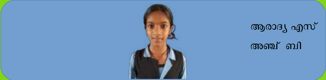
ആരാദ്യ എസ് അഞ്ച് ബി