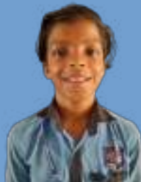
ദിൽജിത്ത് ആറ് ഇ

"എത്ര മനോഹരമെന്റെ നൂല് സ്വന്തമായി ഞാൻ നെയ്ത പട്ടുനൂല് ആരുമെകണ്ടാൽ കൊതിച്ചു പോകും അത്രയ്ക്കും നേർത്തതാണെന്റെനൂല് ഒരു പ്രാണിതൻ വീണു പോയാൽ എൻ നൂലിൽ ഒട്ടിപിടിച്ചീടുന്നു അവയെ ഞാൻ ആഹാരമാക്കിടുന്നു അങ്ങനെ ഞാൻ നീന്നിടുന്നു"