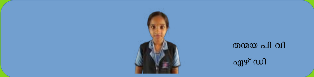
തന്മയ പി വി ഏഴ് ഡി

കേരളീയ ജീവിതത്തിലെ സാമൂഹ്യയാഥാർഥ്യങ്ങളെ തീഷ്ണമായി അനുഭവവേദ്യമാകുന്ന ജീവസ്സറ്റ കഥകൾ അടങ്ങിയ ഒരു കൊച്ചു പുസ്തകമാണിത്. മലയാള ചെറുകഥകളിൽ ഏറ്റവും ശ്രദ്ധേയമായ ഏഴു കഥകൾ ആണ് ഈ പുസ്തകത്തിൽ ഉള്ളത്. ഈ കഥകൾക്ക് നാടൻ ഭാഷാശൈലി മാറ്റ് കൂട്ടുന്നു. ഈ പുസ്തകത്തിന് സമൂഹത്തിലുള്ള പ്രസക്തി ചെറുതൊന്നുമല്ല. സമൂഹത്തിലെ യാതനകളും വേദനകളും ആഘാതങ്ങളുമാണ് ഈ പുസ്തകത്തിൽ കഥകളായി രൂപാന്തരപ്പെട്ടിരിക്കുന്നത്.. കഥാകൃത്ത് സമൂഹത്തിന്റെ പ്രതിരൂപമാണ് ഈ കഥയിലൂടെ ആവിഷ്കരിക്കാൻ ശ്രമിക്കുന്നത് നാടൻ പദപ്രയോഗവും അർത്ഥവത്തായ വാക്കുകൾകൊണ്ടും മനോഹരമായ കഥകൾ അടങ്ങുന്ന പുസ്തകം എന്ന ഏറെ ചിന്തിപ്പിച്ചു.