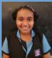
ആര്യനന്ദ ടി എസ് ആറ് ബി