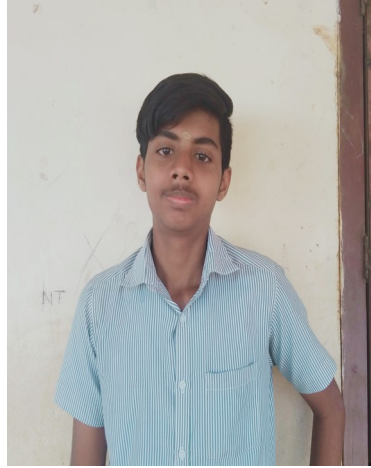
ചീഫ് എഡിറ്റർ സായത്ത് .ടി