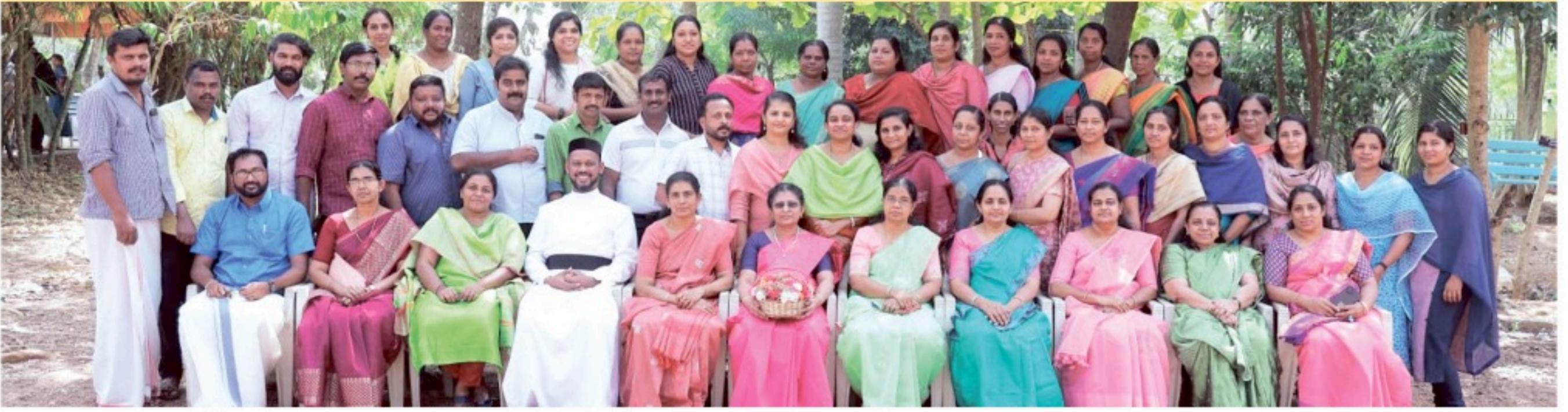
ആരക്കുന്ന് സെന്റ് ജോർജ്ജ് സഹായസംഘത്തിലെ അദ്ധ്യാപകരും ജീവനക്കാരും