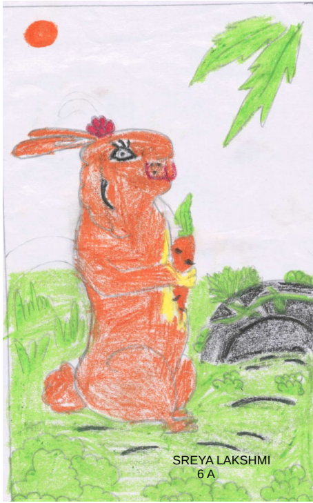
SREYA LAKSHMI 6 A