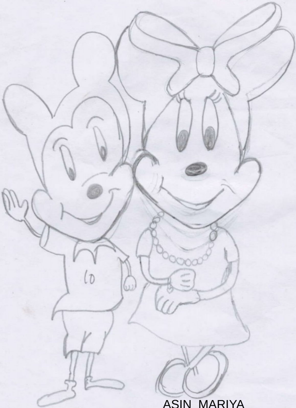
ASIN MARIYA 6 C