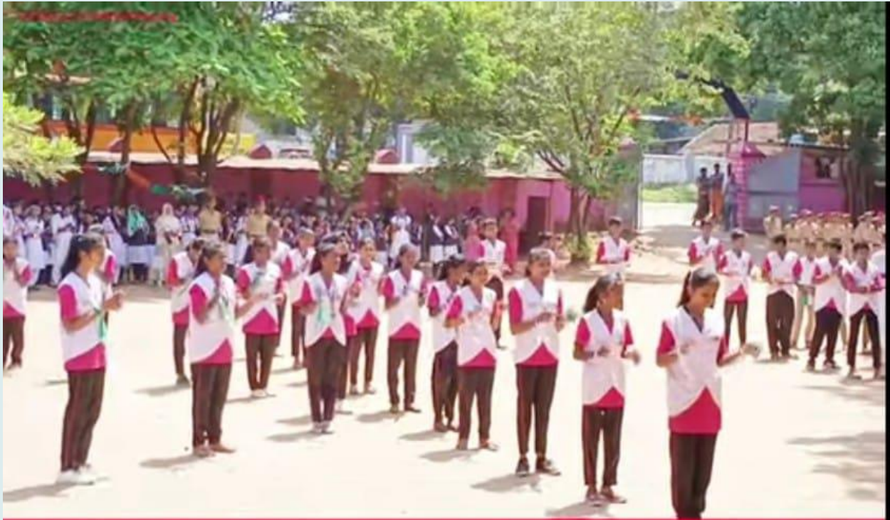
77 TH INDEPENDENCE DAY CELEBRATION © ST. PAUL'S HIGH SCHOOL, KOZHINJAMPARA-PALAKKAD (ESTD-1947)