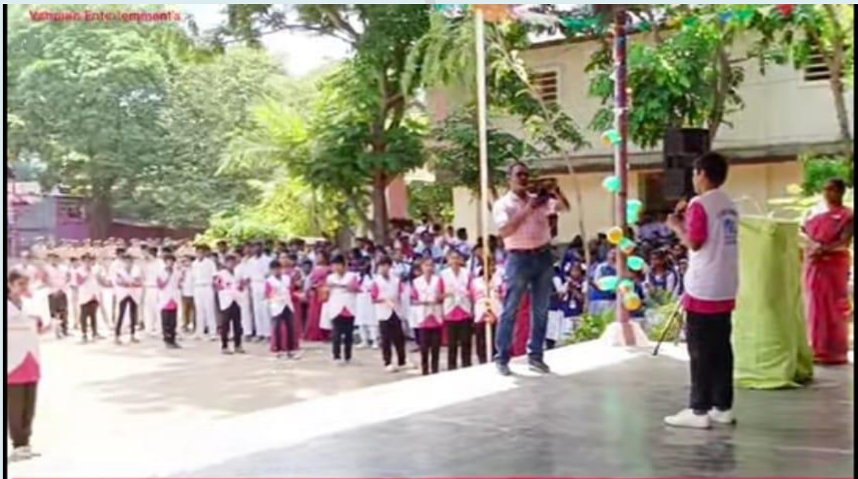
77 TH INDEPENDENCE DAY CELEBRATION © ST. PAUL'S HIGH SCHOOL, KOZHINJAMPARA-PALAKKAD (ESTD-1947)